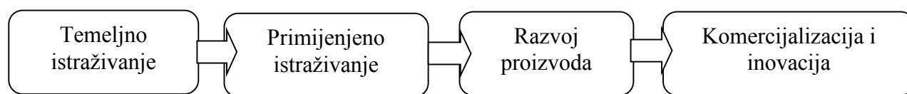
Slika 1. Linearni model inovacija [1]

više istraživačkih (R&D) aktivnosti će uzrokovati više inovacija i povećati inovativnost gospodarstva.