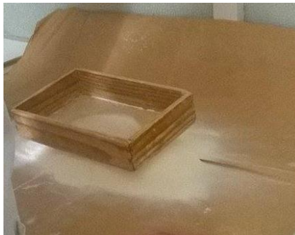
Slika 3. Prosijano brašno

Analiziralo se pšenično brašno tipa 550, ćelija 22. uzorak od 2 kg je priređen od uzoraka brašna. Brašno se nakon toga prosijava (Slika 3) da bude ujednačeno i da se prozračí. Prosijavanje služi kako bi se uklonila strana tijela iz brašna i zatim se vraća u vrećicu (Radna uputa za provođenje fizikalno – kemijskih analiza. PJ Požežanka u Požegi, 2016).