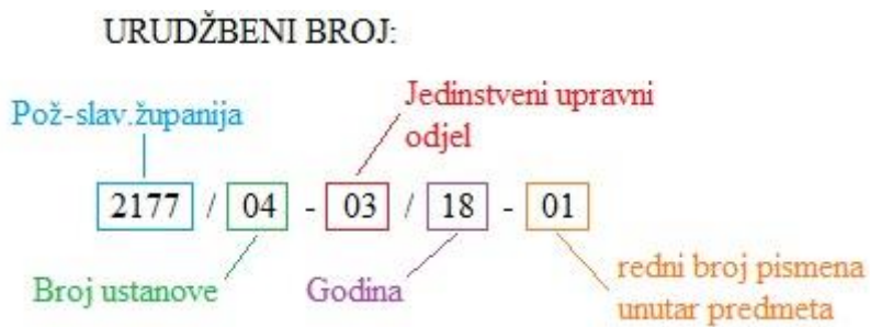
Shema 2. Prikaz urudžbenog broja u općini Jakšić