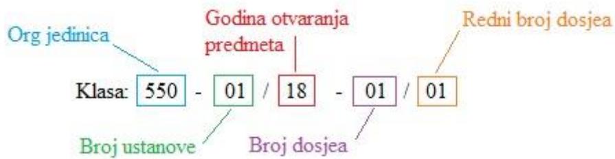
Shema 1. Prikaz klasifikacijske oznake u općini Jakšić