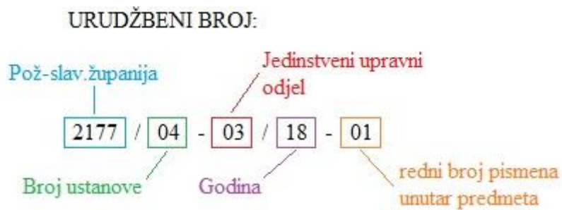
Shema 2. Prikaz urudžbenog broja u općini Jakšić