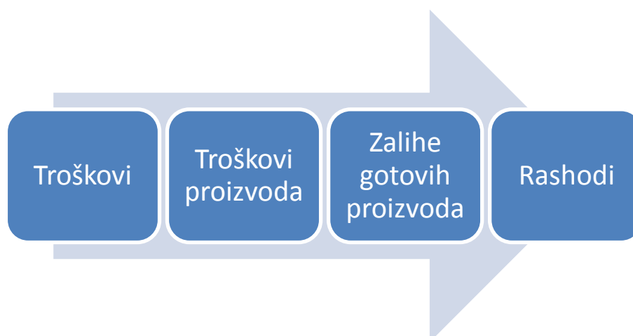
Slika 1. Tijek kretanja troškova proizvoda