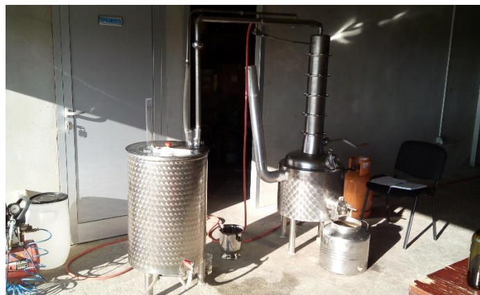
Slika 5. Uređaj za destilaciju

Osnovni dijelovi klasičnog uređaja za pečenje rakije su: kotao s dijelom za destilaciju i dijelom za zagrijavanje, kapa, klobuk ili poklopac (gornji dio kotla), cijev od poklopca do hladila i hladilo s predloškom. (Banić, 2006)