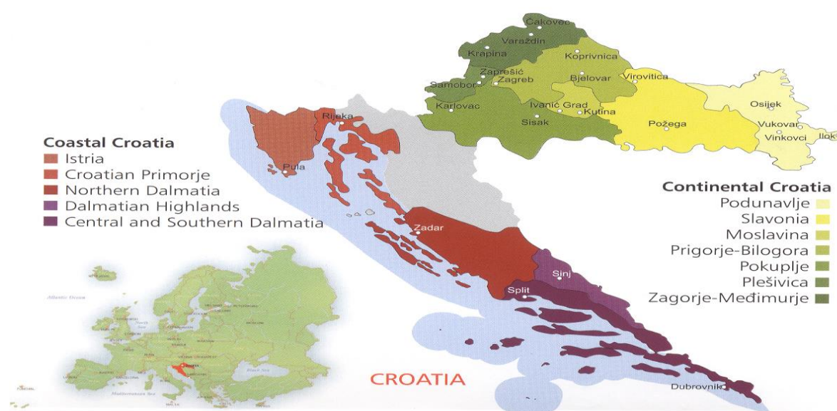
Slika 1. Vinogradarske podregije u Republici Hrvatskoj