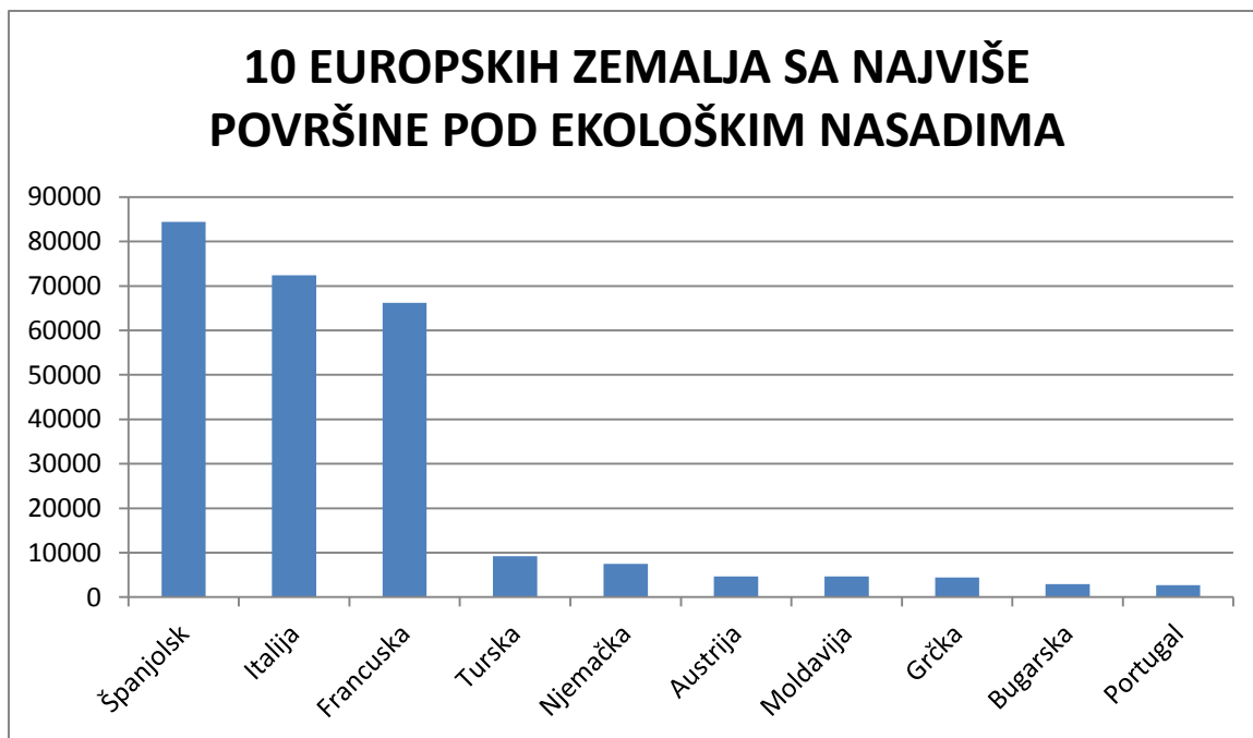
Grafikon 1. 10 Europskih zemalja sa najviše površine pod ekološkim nasadima