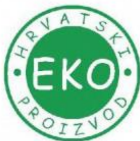
Slika 3. Hrvatski ekoznak