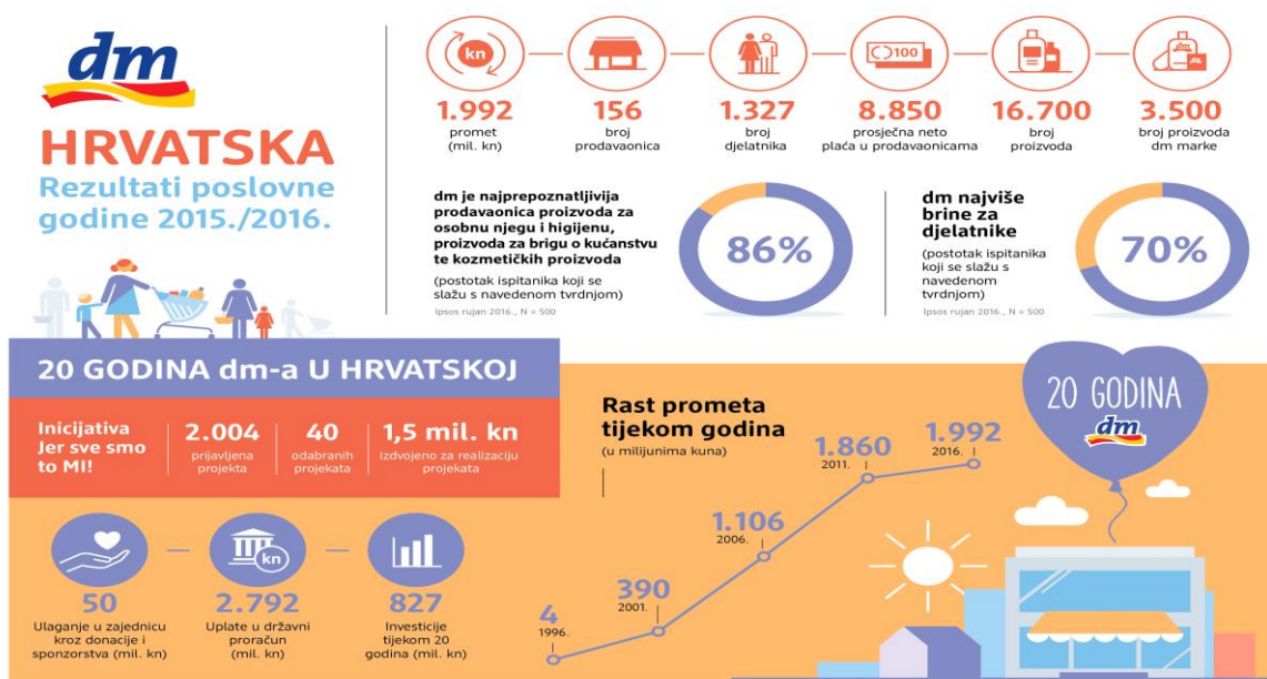
Slika 5 Pregled poslovanja DM-a

Prema istraživanju agencije Ipsos Plus prodavaonice DM-a prvi su izbor kupovine kozmetike i zdrave hrane. Jedan od razloga takvog rezultata jest sigurno i jedinstven koncept kupnje koji je sažet u poruci „Tu sam čovjek“. Kupci su u Dm prodavaonicama prepoznali odličan omjer cijene i kvalitete, filozofiju poslovanja koja je okrenuta čovjeku, stavivši čovjeka i njegove potrebe u centar. Svojim kupcima DM nudi kvalitetnu uslugu, povoljniju kupnju, iznimno kvalitetne vlastite robne marke, dostupnost i blizinu, ali i mogućnost aktivnog uključivanja u društveno odgovorne projekte.