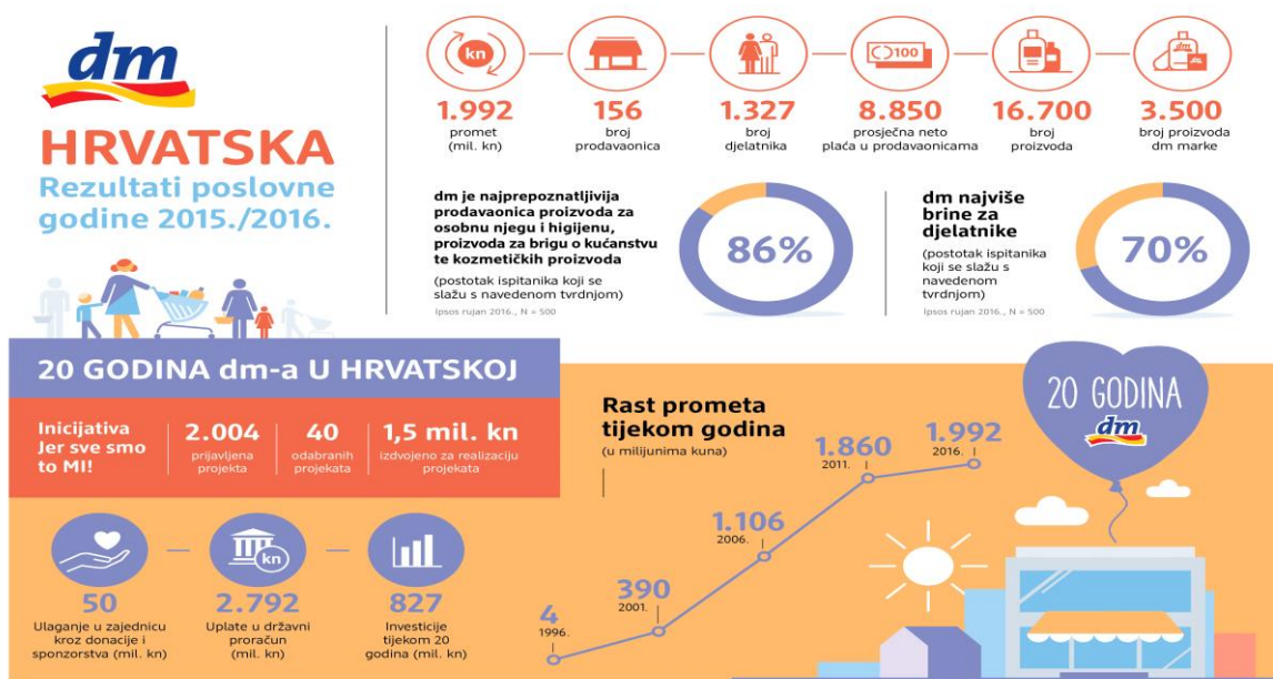
Slika 5 Pregled poslovanja DM-a

Prema istraživanju agencije Ipsos Plus prodavaonice DM-a prvi su izbor kupovine kozmetike i zdrave hrane. Jedan od razloga takvog rezultata jest sigurno i jedinstven koncept kupnje koji je sažet u poruci „Tu sam čovjek“. Kupci su u Dm prodavaonicama prepoznali odličan omjer cijene i kvalitete, filozofiju poslovanja koja je okrenuta čovjeku, stavivši čovjeka i njegove potrebe u centar. Svojim kupcima DM nudi kvalitetnu uslugu, povoljniju kupnju, iznimno kvalitetne vlastite robne marke, dostupnost i blizinu, ali i mogućnost aktivnog uključivanja u društveno odgovorne projekte.