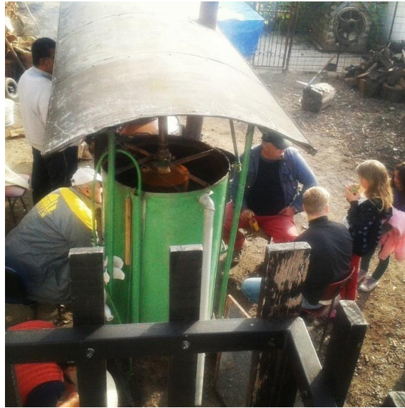
Slika 3. - Stroj za pečenje rakije

Osnovni dijelovi klasičnog, uređaja za pečenje rakije su: kotao s dijelom za destilaciju i dijelom za zagrijavanje, kapa, klobuk ili poklopac (gornji dio kotla), cijev od poklopca do hladila, i hladilo s predloškom.