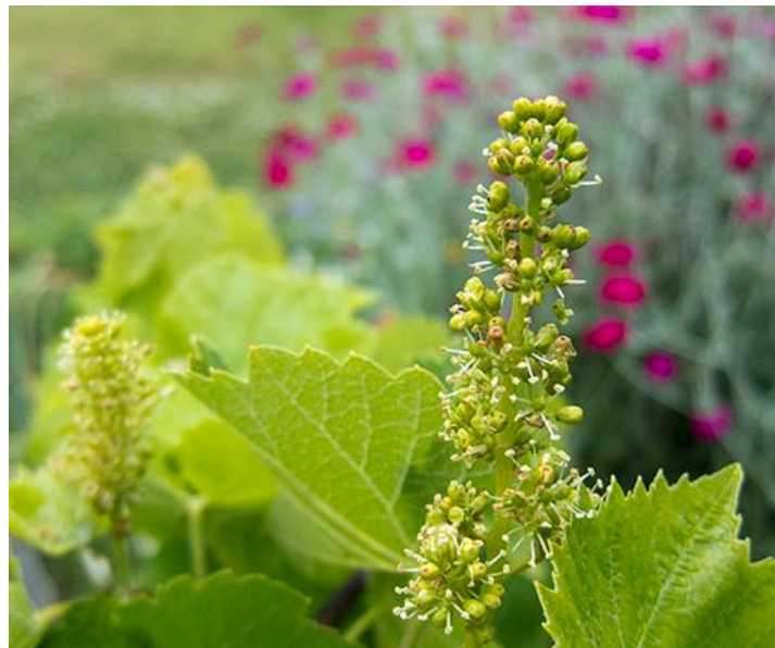
Slika 1. Cvat vinove loze