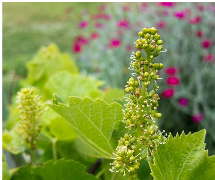
Slika 1. Cvat vinove loze