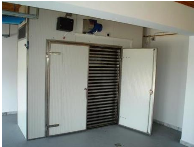
Slika 7. Komorna sušnica za voće

Može biti zidana ili izgrađena od metalnih ploča u kojima je tvar koja se suši poredana u lijese. Lijese su postavljene na vagonete. Sušenje se obavlja zrakom kojega u sušaru tlači jedan, a iz sušare odsisava drugi ventilator. Zrak se prethodno grije u kaloriferu, a zatim se ventilatorom tlači između donje trećine lijesa. Nedostatak je ovih sušara u tome: što sušenje traje relativno dugo (jer tvar miruje za vrijeme sušenja), imaju mali učinka, tvar se nejednoliko suši, utrošak radne snage je velik (jer se tvar na lijese stavlja ručno), ovisno o tvari sušenje traje oko 4 ili više sati (Sušenje, 20.06.2017., url).