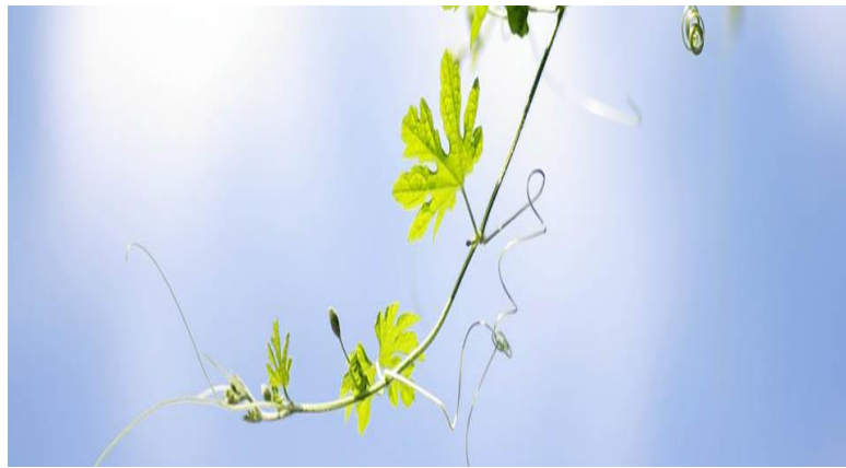
Slika 3. Vitice vinove loze