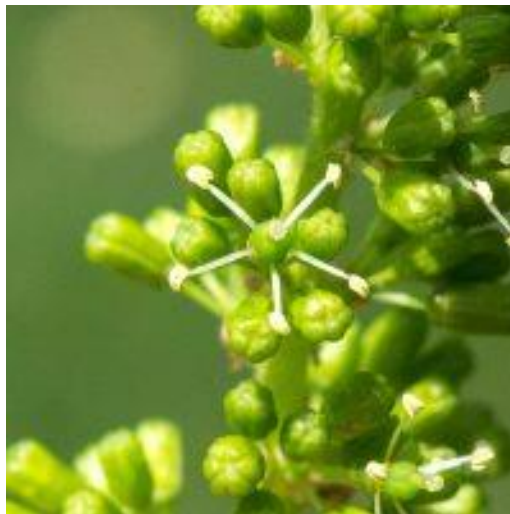
Slika 2. Cvijet vinove loze