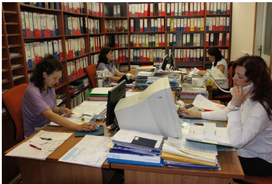
Slika 4: Knjigovodstveni ured

Poduzetnik je dužan prikupljati i sastavljati knjigovodstvene isprave, voditi poslovne knjige te sastavljati financijske izvještaje sukladno ovom Zakone i na temelju njega donesenim propisima, poštujući pri tome standarde financijskog izvještavanja te temeljna načela urednog knjigovodstva.