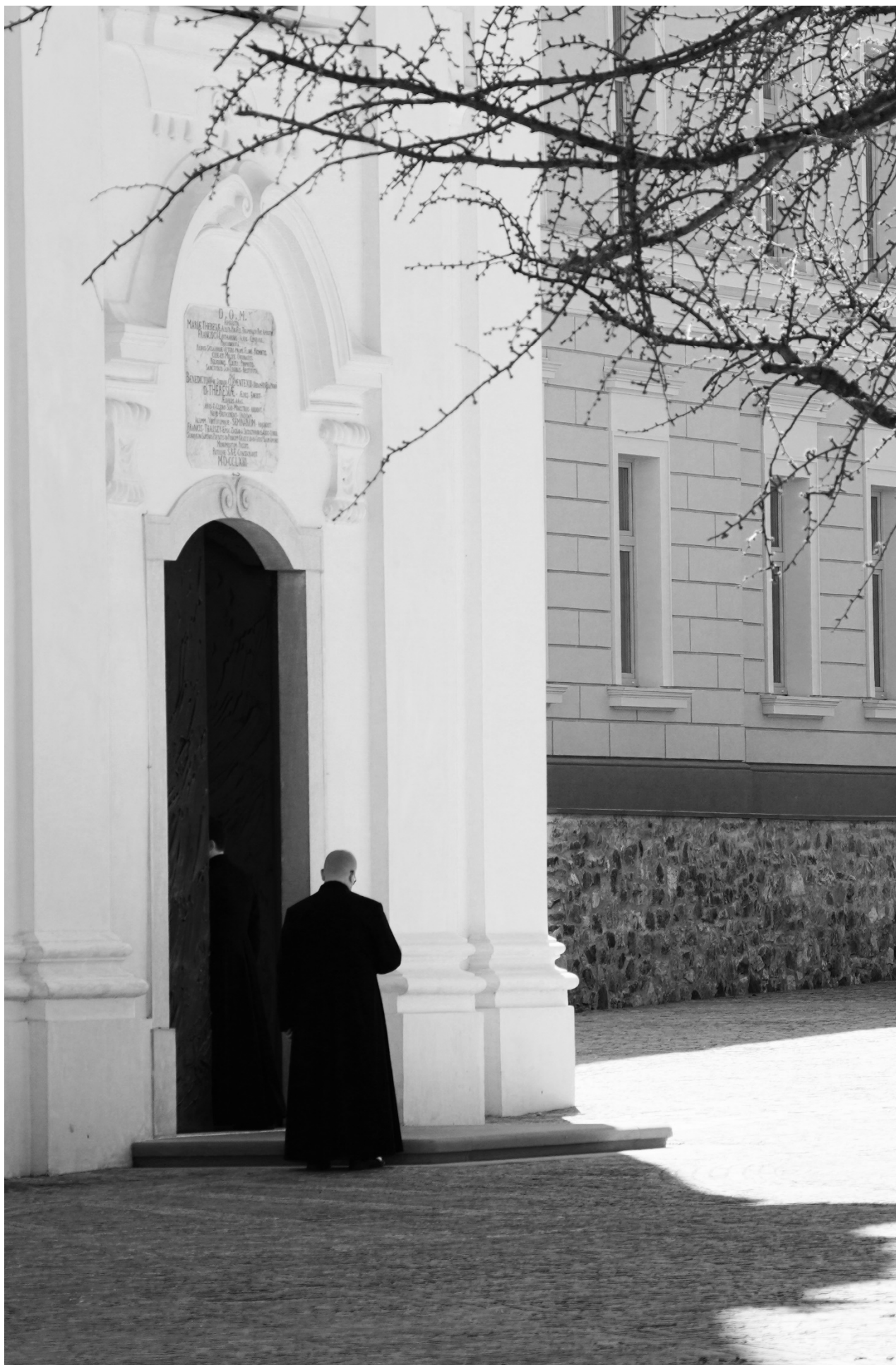
Photo 076. Svećenik / Chaplains