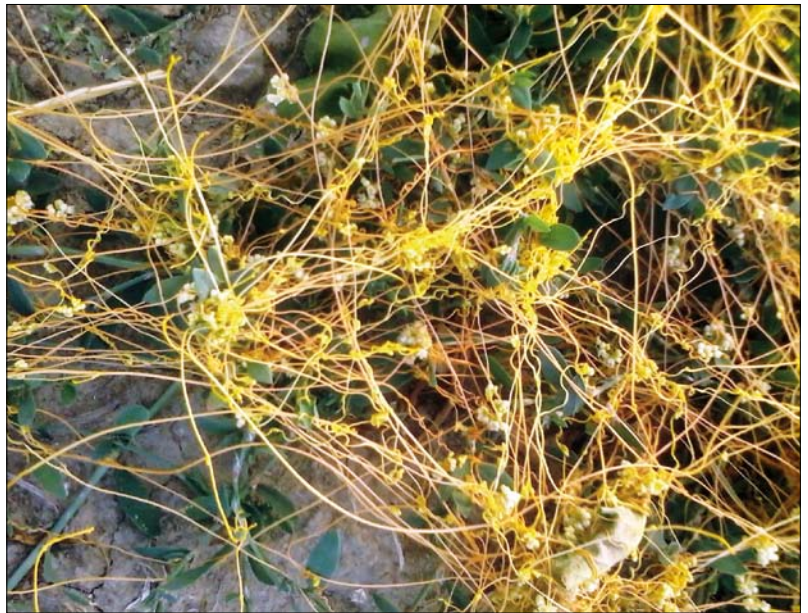
Obr. 2. Květy rostliny kokotice v malých shlucích podél stonků

umožnil rovnoměrné náhodné rozložení polí s cukrovou řepou i blízkých pozemků v rámci sledovaných oblastí (podobný půdní typ a prvky krajiny). Pozorování byla prováděna od června do září za plné vegetace a na všech plochách, kde byla potvrzena přítomnost kokotice, byly zaznamenány souřadnice GPS a odpovídající nadmořská výška. Na každém pozemku (celkově 174 lokalit v obou letech) byla přítomnost kokotice odhadnuta použitím Daubenmirovoy stupnice (15). Ta spočívá ve vizuálním odhadu jedné ze šesti tříd pokrytí s následujícím rozsahem: 1 (≤5%), 2 (5–25 %), 3 (25–50 %), 4 (50–75 %), 5 (75–95 %), 6 (95–100 %). Intenzita napadení byla rozdělena do tří kategorií: