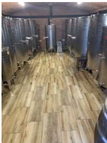
Slika 2. Podrum vinarije RAMARIN

Samo grožđe na trsovima je u stanju prezrelosti, bobice su u stanju prosušivanja i vrijednost izmjerene suhe tvari koncentracije (šećera) izmjereno u stupnjevima Oechslea(*Oe) iznosi 111(*Oe). Kako su kategorije predikatnih vina definirane Zakonom o vinu berba Crnog Pinota 2018. godine spada u kategoriju Izborna berba. Vinarski inspektor na dan berbe uzima uzorak masulja kako bi se dobila potvrda koja nam dokazuje da zaista to grožđe i sama berba spada u kategoriju predikatnih vina Izborna berba. Potvrda vinarskog inspektora je u prilogu rada. Rok berbe određen je po ustaljenim pravilima prateći stanje grožđa, suhe tvari i kiselina. Mjerenjem prije dva tjedna izmjereno je 96 Oechslea što pokazuje rast suhe tvari u bobicama za 15 stupnjeva Oe.