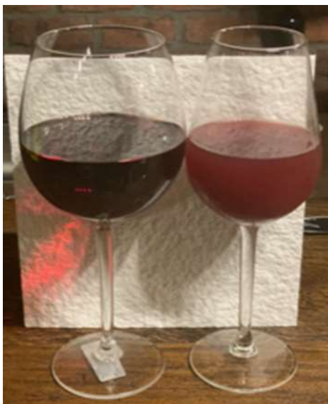
Slika 5. Izgled vina prije i poslije filtriranja

Nakon filtriranja, vino je zablistalo mirisom i okusom i više nije bilo nikakvih naznaka fermentacije, kako se prikazuje na sljedećoj slici.