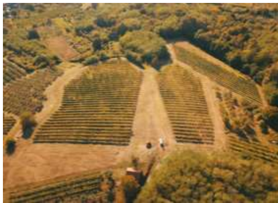
Slika 1. Položaj vinograda vinarije RAMARIN

Godina 2018. po službenim podacima Državnog hidrometeorološkog zavoda (meteo.hr) je još jedna godina koja spada u kategoriju ekstremno topla za cijelu Hrvatsku, a i podatak za oborinske prilike šireg područja Slavenskog Broda za mjesec rujan 2018. godine pokazuju da spada u kategoriju sušno. Većina vinogradara obavila je svoje berbe već krajem kolovoza na području vinogorja Slavonski Brod, pa tako i vinarija RAMARIN, koja je u sklopu ranča RAMARIN, Adresa vinograda je Klokočevik, broj čestice je 1325442, čiji vinograda se prikazuje na slici 1.