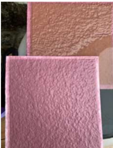
Slika 4. BECOPAD ploča nakon filtriranja

Berba 2018. je još dva puta pretočena bez dodavanja ikakvih umjetnih bistrila samo Sumpovin. Najveći problem s kojim se susrelo je da se počela odvijati refermentacija bez obzira na količinu sumpora 20 u vinu i temperaturu koja je bila ispod 10 stupnjeva. Kako bi se to zaustavilo odrađena je filtracija vina pločastim filterom i to s BECOPAD pločama 450 i 220, takozvana dvostruka polusterilna filtracija. Prilikom filtriranja omjer ploča 20*20 bio je 16-450,14-220, kako je prikazano na sljedećoj slici.