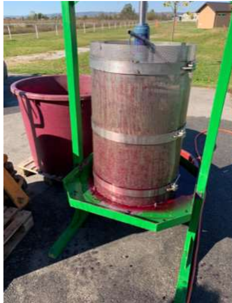
Slika 6. Prešanje crnog Pinota

Grožđe je bilo pet dana u maceraciji a da pri tome nije došlo do fermentacije masulja. Zatim je odrađeno prešanje masulja zajedno kruta i tekuća frakcija i sve zajedno je pretočeno u tank od inoxa.