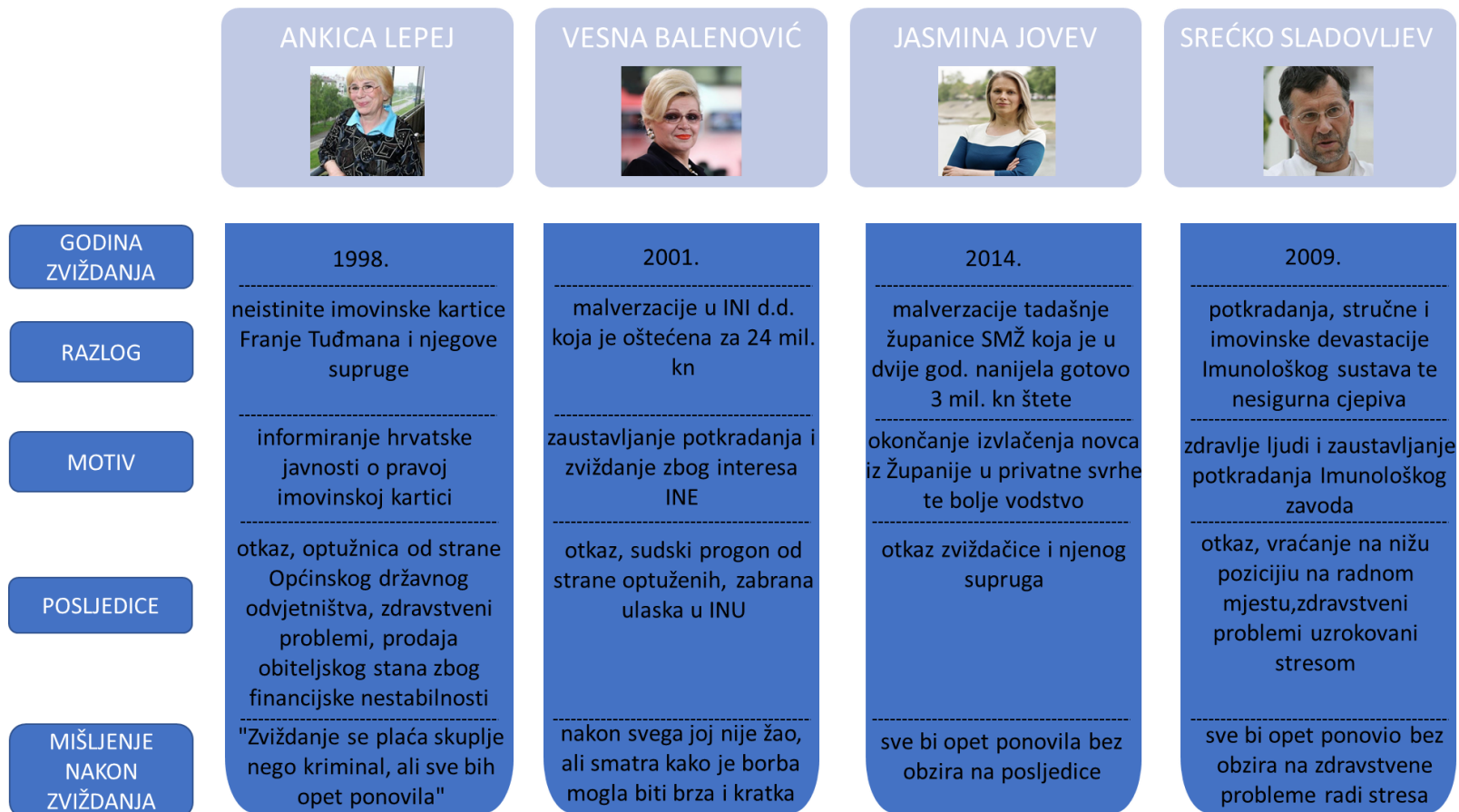
SLIKA 3: 4 SLUČAJA „ZVIŽDANJA“