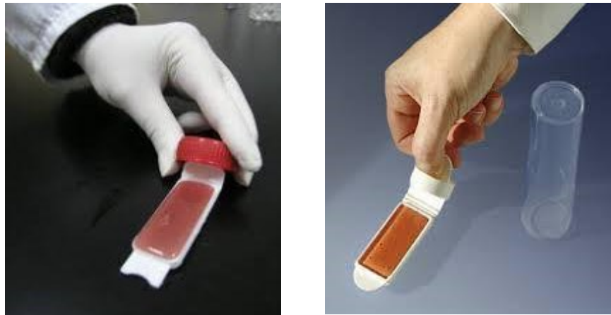
Slika 8. Izgled otisne pločice

Druga strana mikrobiološke pločice(Slika 8), VRBG ( Violet Red Bile Glucose agar ) sadrži podlogu za rast bakterija iz porodice Enterobacteriaceae . Žučne soli sa te podloge inhibiraju rast gram pozitivnih bakterija, te tako svi rodovi iz porodice fermentiraju glukozu što rezultira promjenom pH podloge i promjenom boje indikatora u različite nijanse crvene boje. Kolonije se nakon otiska pri 32-35 °C mogu ustanoviti već nakon 14-16 sati.