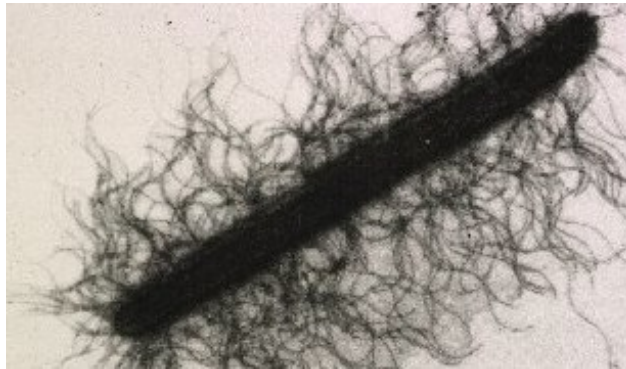
Slika 2. Proteus mirabilis (Tehnologija hrane URL)

Rod Proteus raspostranjen je na zemlji, u vodi, fekalijama, organskim materijama te namirnicima. U svom radu Duraković i Redžepović (2005.) tvrde da su dva najvažnija predstavnika roda Proteus mirabilis (Slika 2) i Proteus vulgaris , gram-negativnih, štapićastih struktura koje imaju flagele, vrlo su pokretljive, te nemaju sposobnost sinteze kapsule. Značajne probleme koje izazivaju su urinarne infekcije, meningitisi, infekcije rana, pneumonija. Proteus vulgaris je otporan na pencilin i većinu cefalosporina, a osjetljiv je na dezinfekcijska sredstva, dok je Proteus mirabilis otporan na pojedine dezinficijense, a osjetljiv je prema antibioticima.