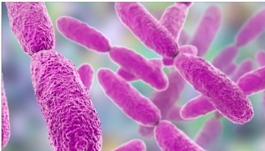
Slika 1. Enterobakterije (Zdravlje, URL)

Enterobakterije (Slika 1) su kratki gram - negativni, većinom pokretni štapići koji ne stvaraju spore i mogu preživjeti u vrlo nepovoljnim uvjetima. Porodica obuhvaća oko 100 srodnih bakterijskih vrsta koje su razvrstane u 30 rodova, uz stalnu tendenciju porasta. Enterobakterije ili crijevne bakterije nalaze se kao normalna mikroflora probavnog sustava u ljudskom i životinjskom organizmu. Neke enterobakterije su stalno naseljene u organizmu, ostale se nalaze samo kod dijela populacije, dok se jedan dio javlja samo kod oboljenih organizama. Uz stafilokoke i streptokoke, spadaju u najčešće uzročnike bolesti kod ljudi.