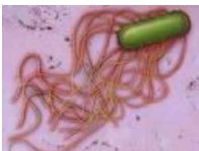
Slika 3. Izgled bakterije Salmonella Pullorum

Salmonella spp. su bakterije koje broje više od 2200 serotipova (Slika 3), a raspoređene su prema staništu i vrsti bolesti koju uzrokuju. Optimalna temperatura je 37 °C, ali je otporna na niske temperature (Obradović, 2002, navedeno u radu Rupčić M. (2016)). Simptomi trovanja hranom kod ljudi podijeljeni su u tri klinička oblika bolesti- salmoneloze. Prvi se odnosi na dijareju uz visoku temperaturu, drugi oblik je septicemija koja se općenito smatra blažom infekcijom krvi te je obilježena smrtnošću do 13 %, te treći oblik rezultira oštećenjem inficiranih tkiva i organa.