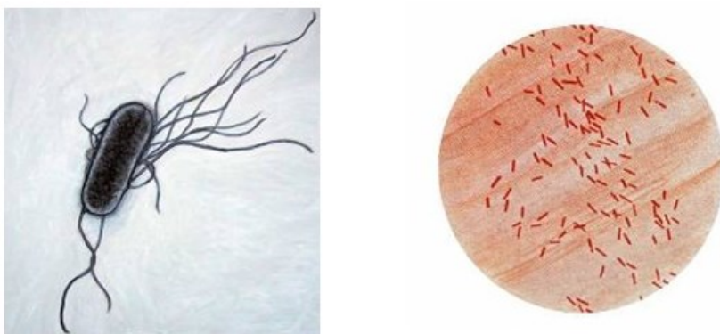
Slika 4. Izgled bakterija Escherichia Coli (Tehnologija hrane, URL)

Escherichia coli (Slika 4) mogu biti gram-negativne pokretne ili nepokretne štapičaste bakterije. Jedna je od bakterija koja obitava u probavnom sustavu sisavaca i smatra se najviše istraženim organizmom u mikrobiologiji.