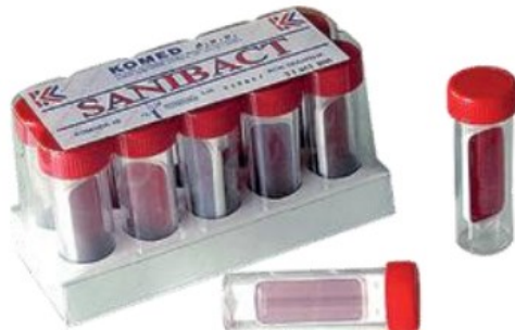
Slika 7. Pločice za uzimanje otisaka (Komed, URL)

Za uzimanje uzoraka korištene su otisne gel pločice (Slika 7) površine 10 cm 2 kojima se bakterije odvajaju s raznih površina ovlaživanjem i usisavanjem, te na kojima se umnažaju te uz pomoć kojih se dokazuje njihova prisutnost. Pritisak na uzorak se vrši u trajanju od 15 sekundi relativno blagom silom.