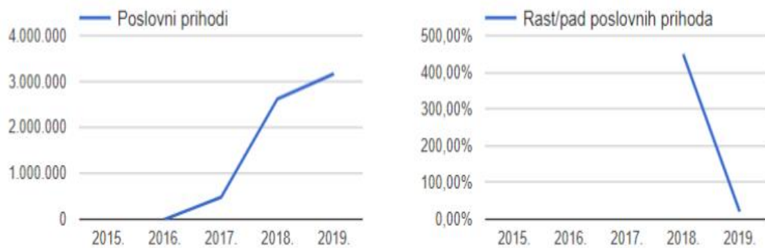
Slika 4. Graf poslovnih prihoda i rasta/pada poslovnih prihoda tvrtke Portes d.o.o.