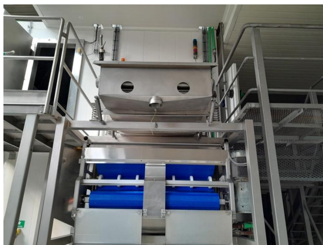
Slika 2. Tunel za smrzavanje

Proizvodi koji se smrzavaju pomoću IQF tehnologija obično su manji komadići prehrambenih proizvoda i mogu se kretati od svih vrsta bobičastog voća, voća i povrća na kockice ili kockice, morskih plodova poput škampa i sitne ribe, mesa, peradi. Proizvodi koji su bili podvrgnuti IQF-u nazivaju se Pojedinačno brzo smrznuto ili IQF. Kratko smrzavanje sprječava stvaranje velikih kristala leda u stanicama proizvoda, što uništava membranske strukture na molekularnoj razini. To čini da proizvod u velikoj mjeri zadrži svoj oblik, boju, miris i okus nakon odmrzavanja. (Anonymus, 2016, url)