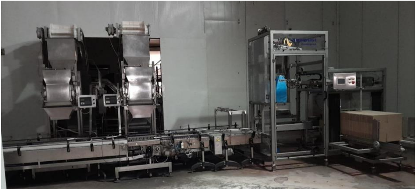
Slika 9. Automatske vage i stroj za pravljenje kutija

Pakiranje se vrši pomoću automatskih vagi ( 2 komada) kapaciteta 4t/h. Svaka vaga je naštimana da dozira 10 kg smrznute višnje. Izvagana višnja pada u kartonske kutije koje se također prave automatski. Kartonske kutije sa višnjom putuju trakom do stroja za ljepljenje kutija te tako zaljepljene kutije prolaze kroz metalni detektor.