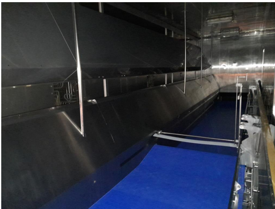
Slika 7. Protočni tunel za smrzavanje

Obavezno vršimo provjeru temperature proizvoda digitalnim termometrom kada izađe iz tunela jer temperatura ne smije biti ispod -18^{\circ}\text{C} . Hladni lanac nama omogućava da ne dođe do zagrijavanja proizvoda tijekom njihovog skladištenja i otpreme.