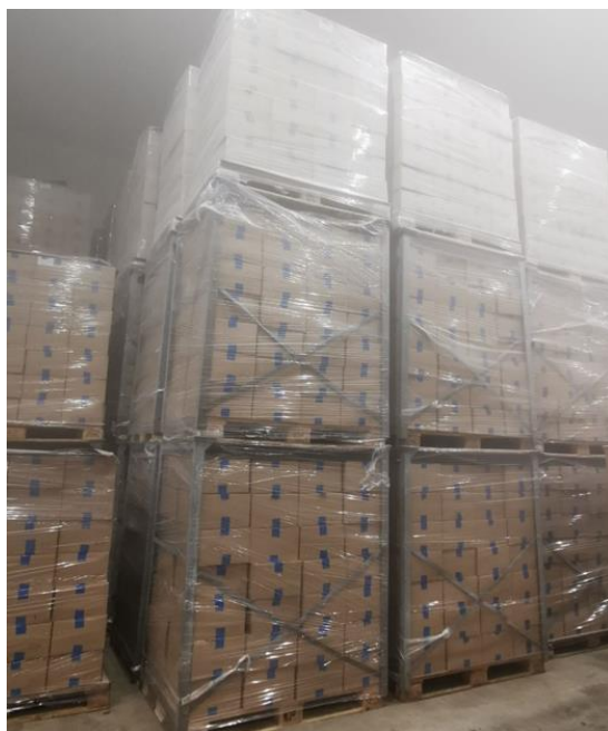
Slika 10. Smrznuta višnja u komori za skladištenje