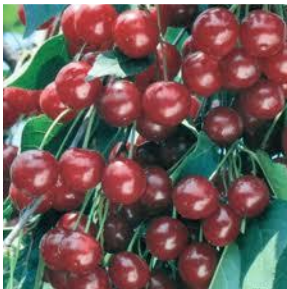
Slika 1. Višnja Oblačinska (Agroportal, url)

S obzirom na nutritivne vrijednosti Oblačinske višnje pri čemu se ističe značajan izvor antioksidanata, uključujući i antocijanine i spojeve polifenola koji su uključeni u antioksidativnu borbu protiv biotskog i abiotskog stresa, ima pozitivan utjecaj na zdravlje ljudi te je vrlo popularna kao voćni nasad. (Viljevac, 2012)