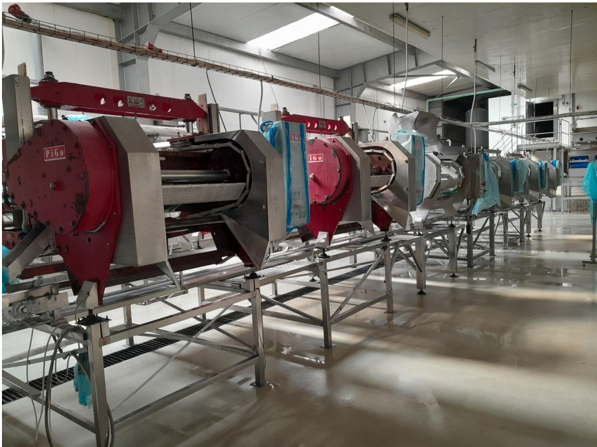
Slika 6. Izbijačice za košticu

Višnja sa inspeksijskih traka putuje do trake koja vodi na izbijačice. Izbijačice su povezane sa kalibratorom te su odvojene prema frakciji višnje (< i > od 16 mm). Frakcija višnje < od 16 mm, odlazi na posebne izbijačice gdje su ploče smanjenje odnosno kod frakcija > od 16 ploče su povećane. Cijeli proces je automatiziran, a tempo količine višanja određuje semafor postavljen na bazenu. Igle koje izbijaju košticu su složene identično kao i rupe na pločama. U ovom procesu je bitno da ploče budu namočene vodom radi ne trošenja gumica na pločama. Kada ploča sa višnjom dođe u gornju zonu, ruka sa iglama se spušta i izbija košticu. Koštica pada na beskonačnu traku koja prolazi kroz središnji prostor svih 6.strojeva i iznosi ih u pasirku za odvajanje koštica putem centrifugalne sile. Koštica se na kraju skladišti u plastičnim euroboxovima te se koristi kao ogrijevni materijal. Višnja kojoj je koštica izbijena pada na traku i odlazi na smrzavanje u tunel. Vrlo je važno da igle za izbijanje koštice budu sve na broju jer u suprotnom nećemo imati 100% otkošteni gotovi proizvod.