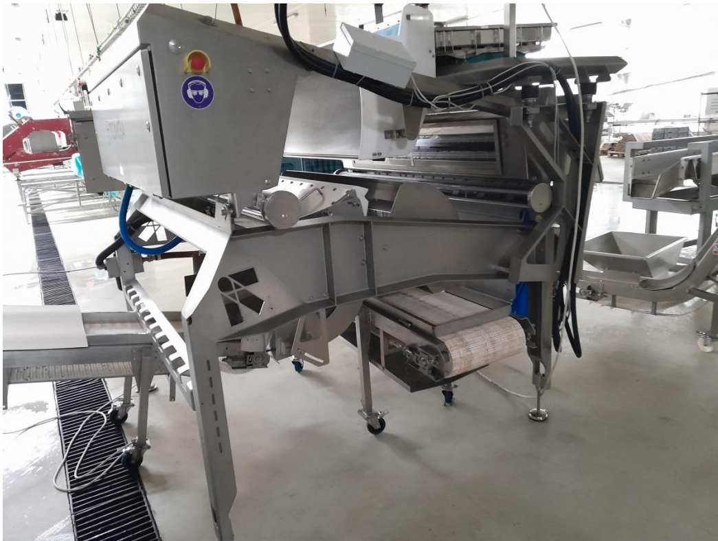
Slika 5. Optički sorter i 1. inspeksijska traka

Optički sorter ili Laser preko kamera očitava boju višnje i pomoću zraka odbacuje svu neodgovarajuću višnju(nedozrelu, trulu, deformiranu). Laser je povezan sa kompresorskom stanicom i mora imati stalni pritisak da bi idealno funkcionirao. Kapacitet optičkog lasera je 5 t na sat. Laser i inspeksijske trake su povezane i čine najvažniju kontrolu u cijeloj preradi zbog kvalitete gotovog proizvoda. Na inspeksijskim trakama rade žene koje vizualno pregledavaju višnju i odstranjuju eventualno zaostale neodgovarajuće plodove. Trake se vrte sporo radi što boljeg pregleda i kontrole. Optički sorter je točan oko 95%, ali u lošijim uvjetima kada je godina lošija ne može odvojiti svu neadekvatnu višnju za preradu.