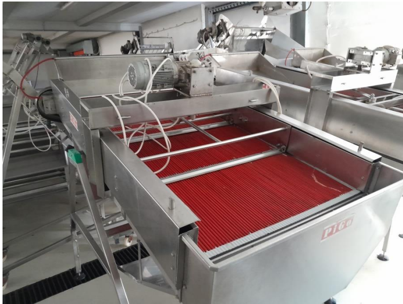
Slika 4. Peteljkar

To je stroj koji služi za odvajanje peteljke višnje od ploda. Pomoćne trake ubacuju višnju na peteljkar koji na sebi ima okretne šipke presvučene gumicama koje svojom rotacijom odvajaju peteljku, lišće i grančice od ploda. Stroj koristi vodu radi lakšeg rada i samog obavljanja zadatka otkidanja peteljke. Ruka koja je postavljena iznad šipki služi za raspoređivanje višnje i ujedno razbacuje vodu po kompletnoj cijeloj radnoj površini stroja. Voda štiti višnju od pucanja i eventualnog deformiranja od strane stroja ali isto tako služi kako ne bih došlo do oštećenja gumica na stroju.