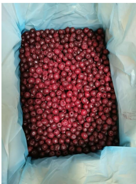
Slika 11. Zapakirana smrznuta višnja u kutiji MPDE vrećici