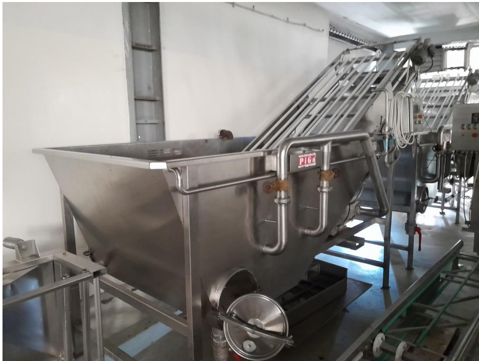
Slika 3. Bazen za pranje višnje

U bazenima se nalazi traka koja služi za transport oprane višnje na peteljcare.