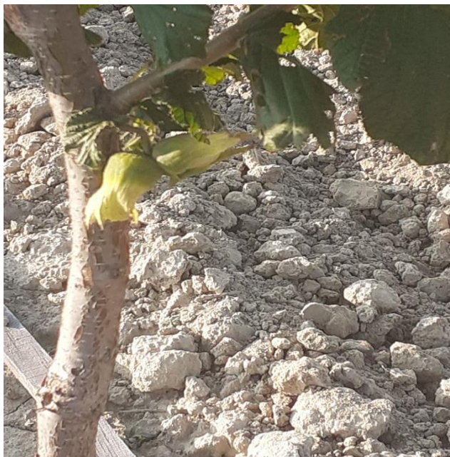
Slika 6. Plodovi lijeske u omotaču

plodova nekih sorti može biti otežana jer svi plodovi ne sazrijevaju istovremeno i kod nekih sorti se teško oslobađaju iz omotača. (Šoškić, 2006.)