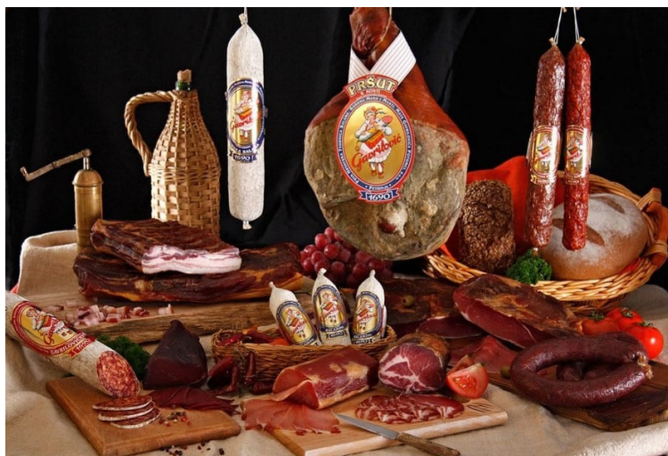
Slika. 1. Gavrilović proizvodi