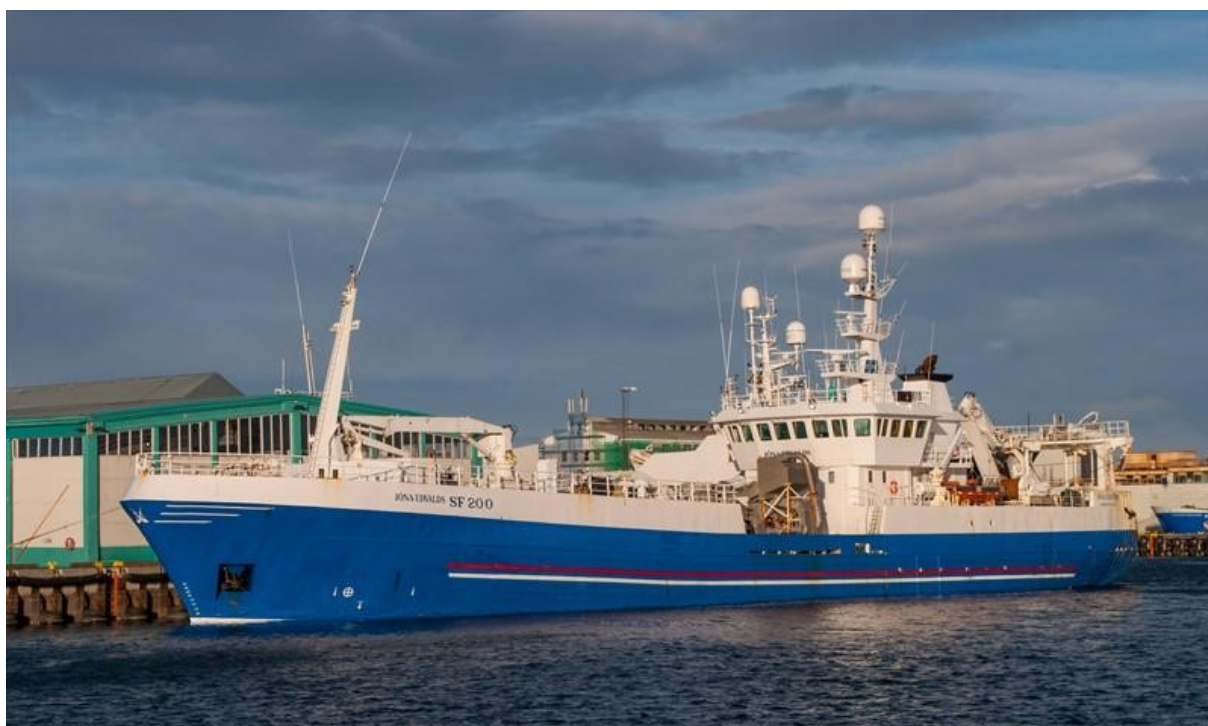
Slika 3. Brod kompanije Skinny-Þinganes, Jóna Eðvalds