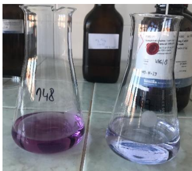
Slika 7. Određivanje ukupne tvrdoće vode

U prethodno označene Erlenmayerove tikvice dodati 100 ml uzorka, dodati pola žličice indikatora Eriokrom crno i 1 ml Amonijeva pufera pomoću automatske birete. Zatim titrirati Kompleksal otopinom za određivanje ukupne tvrdoće vode. Titracija završava promjenom boje iz ružičaste u plavu. Dobiveni rezultat je u njemačkim stupnjevima. Potrebno ga je preračunati u \text{CaCO}_3 mg/l na način da se dobiveni rezultat podijeli s 0,056 (Arhiva Zavoda za javno zdravstvo Požeško-slavonske županije).