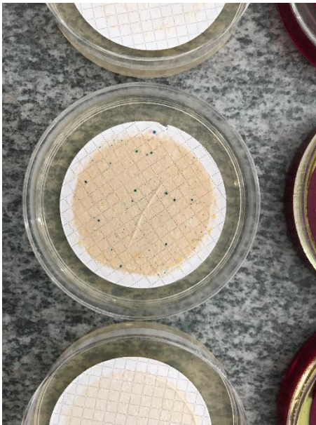
Slika 2. Escherichia coli (Izvor: autor)

Pomoću oksidaza testa utvrđuju se jesu li nastale bakterije E. Coli ili koliformne bakterije. Za utvrđivanje je potrebno ispitati 10 ružičasto do crvenih kolonija na način da se sterilnom ezom prenesu kolonije na papirnati dio oksidaza testa. Pozitivna reakcija očituje se pojavom plavo ljubičaste boje nakon 30 sekundi. Koliformne bakterije su oksidaza negativne (Arhiva Zavoda za javno zdravstvo Požeško-slavonske županije).