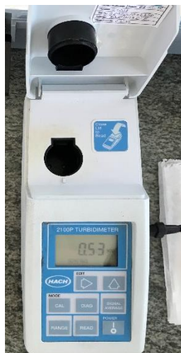
Slika 4. Turbidimetar (Izvor: autor)

Mutnoća se mjeri metodom turbidimetrije pomoću uređaja turbidimetra. U čašicu uliti uzorak vode te staviti u uređaj. Rezultat se izražava u NTU jedinicama (engl. Nephelometric Turbidity Unit ) (Arhiva Zavoda za javno zdravstvo Požeško-slavonske županije).