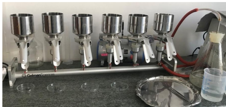
Slika 1. Aparatura za membransku filtraciju

Prije početka filtracije vakuumsku pumpu je potrebno dezinficirati. Dezinfekcija se vrši pomoću vaticice natopljene u 70 %-tni alkohol etanol te plamenika kojim se zatim unište eventualno zaostale bakterije. Nakon toga se uklanjaju graduirani lijevci te se i njih dodatno sterilizira kao i postolje za filter papir. Sterilni ispitni filter papiri se prenose prethodno steriliziranom pincetom u plamenu. Mrežasti dio filter papira okrene se prema gore te se na njih postave i pričvrste sterilizirani lijevci. Zatim se u pričvršćene lijevke ulije 100 ml uzorka vode te se uključi vakuum pumpa i pričekava da se cijeli sadržaj profiltrira. Odmah nakon toga vakuum pumpa se isključi. Ukloni se lijevak te se filter papir sterilnom pincetom prenese na hranjivu podlogu u Petrijevoj zdjelici pazeći da ne zaostaju mjehurići zraka. Ukoliko dođe do stvaranja mjehurića potrebno je podići filter papir i ponovno ga prisloniti uz hranjivu podlogu. Nakon toga se Petrijeve zdjelice stavljaju na inkubaciju. Ovisno o vrsti bakterija razlikuje se vrijeme i temperatura inkubacije (Arhiva Zavoda za javno zdravstvo Požeško-slavonske županije).