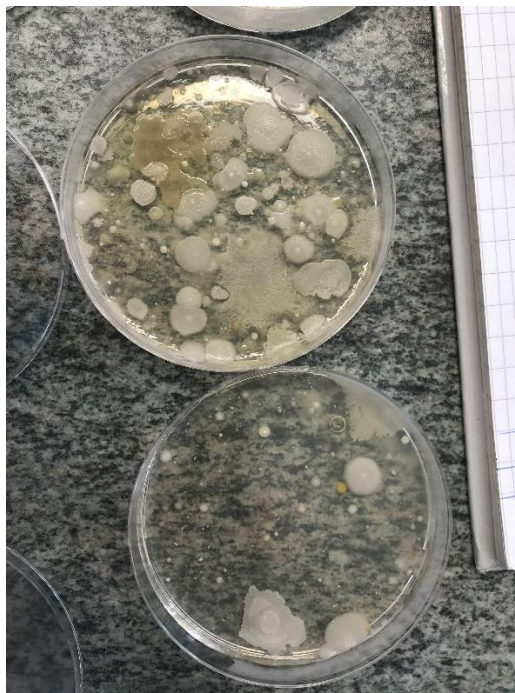
Slika 3. Aerobne mezofilne bakterije

Iz boce s uzorkom u prethodno označene Petrijeve zdjelice sterilnom pipetom dodati 1 ml uzorka. Zatim u Petrijeve zdjelice dodati kvasac za vodu (Tryptone Glucose Yeast Extract Agar) i laganim kružnim pokretima rasporediti po cijeloj površini zdjelice. Kratko pričekati kako bi se podloga učvrstila. Nakon toga Petrijeve zdjelice s uzorkom staviti u inkubator na inkubaciju. Uzorci za određivanje broja kolonija na 22 °C očitavaju se nakon 72 sata, a oni za određivanje broja kolonija na 36 °C nakon 48 sati. Nakon inkubacije slijedi prebrojavanje kolonija. U oba slučaja broj kolonija mora biti manji od 100 (Arhiva Zavoda za javno zdravstvo Požeško-slavonske županije).