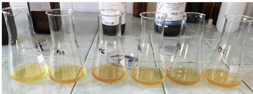
Slika 5. Određivanje klorida u vodi

Kloridi se određuju tehnikom titrimetrije. Za početak je potrebno označiti Erlenmayerove tikvice zatim menzutom odmjeriti 50 ml uzorka. Nakon toga dodati par kapi indikatora K_2CrO_4 (kalijev kromat) i titrirati AgNO_3 (srebrov nitrat). Titracija se vrši do promjene boje iz žute u narančastu. Rezultati se izražavaju u mg/l. Većinom voda za piće sadrži 10 do 30 mg/l klorida (Arhiva Zavoda za javno zdravstvo Požeško-slavonske županije).