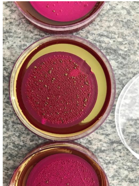
Slika 3. Ukupne koliformne bakterije