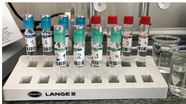
Slika 6. Kivetni testovi za određivanje nitrita, nitrata i amonijaka u vodi (Izvor: autor)

Amonijak u vodi određuje se kivetnim testovima (LCK 304). Nakon skidanja folije s čepa kivete pipetom dodati 5 ml uzorka. Čepom u kojem se nalazi reagens zatvoriti kivetu i promućkati. Štopericom mjeriti 15 minuta (vrijeme reakcije). Rezultat očitati crtičnim kodom u spektrofotometru. Zeleno obojenje pokazatelj je prisutnosti amonijaka u vodi (Arhiva Zavoda za javno zdravstvo Požeško-slavonske županije).