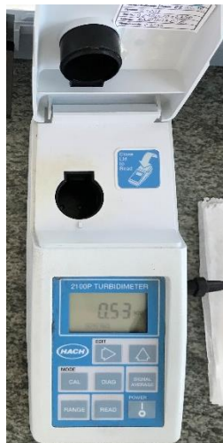
Slika 4. Turbidimetar

Mutnoća se mjeri metodom turbidimetrije pomoću uređaja turbidimetra. U čašicu uliti uzorak vode te staviti u uređaj. Rezultat se izražava u NTU jedinicama (engl. Nephelometric Turbidity Unit ) (Arhiva Zavoda za javno zdravstvo Požeško-slavonske županije).