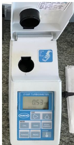
Slika 4. Turbidimetar (Izvor: autor)

Mutnoća se mjeri metodom turbidimetrije pomoću uređaja turbidimetra. U čašicu uliti uzorak vode te staviti u uređaj. Rezultat se izražava u NTU jedinicama (engl. Nephelometric Turbidity Unit ) (Arhiva Zavoda za javno zdravstvo Požeško-slavonske županije).