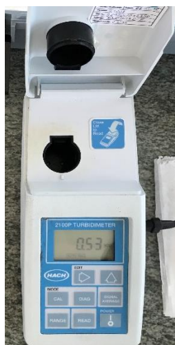
Slika 4. Turbidimetar

Mutnoća se mjeri metodom turbidimetrije pomoću uređaja turbidimetra. U čašicu uliti uzorak vode te staviti u uređaj. Rezultat se izražava u NTU jedinicama (engl. Nephelometric Turbidity Unit ) (Arhiva Zavoda za javno zdravstvo Požeško-slavonske županije).