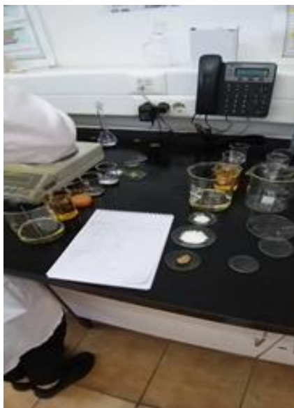
Slika 2. Priprema sastojaka za izradu majoneze