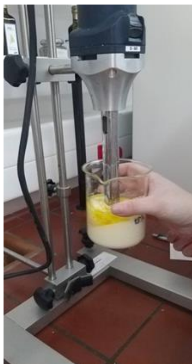
Slika 4. Proizvodnja majoneze pomoću homogenizatora

Priprema uzoraka mase 200 g majoneze pripravljena je na tradicionalan način u laboratorijskim uvjetima, pri sobnoj temperaturi. Proizvodnja majoneze provedena je sa laboratorijskim homogenizatorom model D-500 (Wiggenhauser, Njemačka-Malezija) s područjem brzine rotora 10000 – 30000 o/min (Slika 5) Kod izrade majoneze korišten je sustav rotor/stator (tip rotor ER30 i stator S30F). Uzorci su pripremljeni tako da se prethodno izvažu potrebni sastojci te se dodaje 1/2 suncokretovog ulja, zatim svježi žumanjak jajeta, alkoholni ocat, voda i ostali sastojci, uključujući se homogenizator te se polagano dodaje preostali dio suncokretovog i lanenog ulja te homogenizira tijekom ispitivanog vremena homogenizacije (1, 2, 3, 5 min) kod brzine rotora 10 000 o/min. Priprema uzoraka majoneze napravljena je pri sobnoj temperaturi svih sastojaka, a nakon izrade provedeno je mjerenje reoloških svojstava. Ostali uzorci majoneze pripremljeni su na isti način, samo što su se mijenjali pojedini procesni parametri homogenizacije. Masa svakog pojedinačnog uzorka iznosila je 200 g. Mjerenje svježe pripremljenih uzoraka majoneze je provedeno na rotacijskom viskozimetru s koncentričnim cilindrima na sobnoj temperaturi 25 °C.