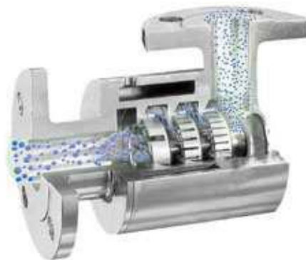
Slika 1. Unutrašnjost homogenizatora (Maxmixermachine, URL)

c) Majoneza se može proizvoditi i pomoću miksera. Ovaj postupak se uglavnom ne koristi u industriji, ali se često koristi i za proizvodnju majoneze u domaćinstvu. Kada se koristi u industriji, potreban je uređaj sastavljen od vertikalne miješalice, elektromotora i reostata koji regulira broj okretaja. Najprije se moraju miješati žumanjci jajeta sve dok se ne razbiju i dok ne nastane homogena smjesa. Nakon toga se dodaju ulje i manja količina octa, a zatim se smanjuje brzina miješanja mikserom te se dodaje ostala količina octa. Ovaj postupak trebao bi se provoditi pri sobnoj temperaturi.