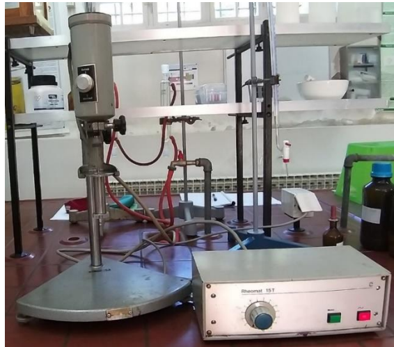
Slika 5. Rotacijski viskozimetar tip "Rheomat 15T"

Mjerni uređaj korišten za određivanje reoloških svojstava svježe pripremljene majoneze je rotacijski viskozimetar tip „Rheomat 15T“ s koncentričnim cilindrima.