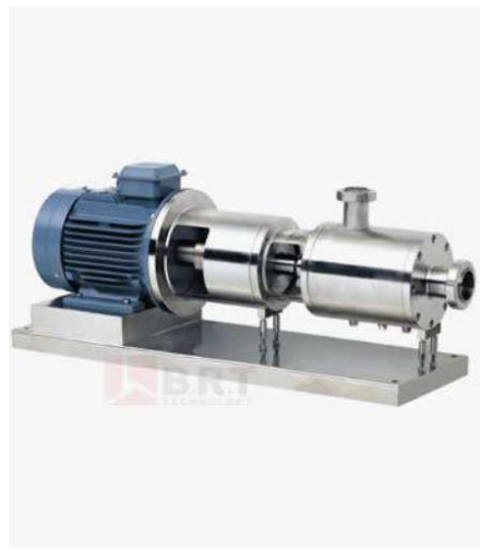
Slika 1. Homogenizator (Maxmixermachine, URL)

emulziju dodaje se ostatak octa te se emulzija propušta kroz homogenizator ili koloidni mlin (Slika 1 i Slika 2).