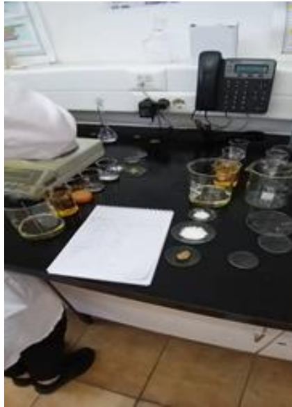
Slika 2. Priprema sastojaka za izradu majoneze