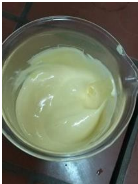
Slika 3. Gotov proizvod majoneza sa 75 %-tnom uljnom fazom