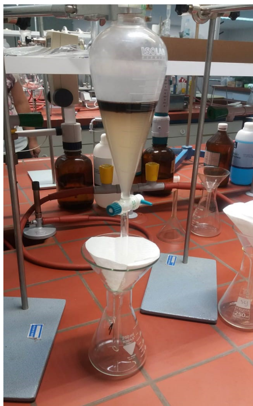
Slika 7. Filtracija smjese

Poslije ekstrakcije i hlađenja sva smjesa se iz okrugle tikvice prelije u lijevak za odjeljivanje od 200 mL te kad se slojevi odvoje donji dio se filtrira u Erlenmeyerovu tikvicu. Za vrijeme filtriranja lijevak se pokrije probušenim satnim staklom da se spriječi isparavanje trikloretilena.