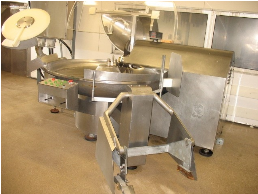
Slika 2. Kuter (Anacom, URL)