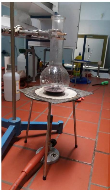
Slika 5. Kuhanje uzorka s HCl

10 g prethodno usitnjenog uzorka potrebno je kuhati sa 20 mL konc. HCl dok se proteini ne rastvore. Nakon što se smjesa ohladila prelije se sa 100 mL trikloretilena te se zatim spoji s hladionikom i kuha 5 – 10 minuta na vodenoj kupelji.