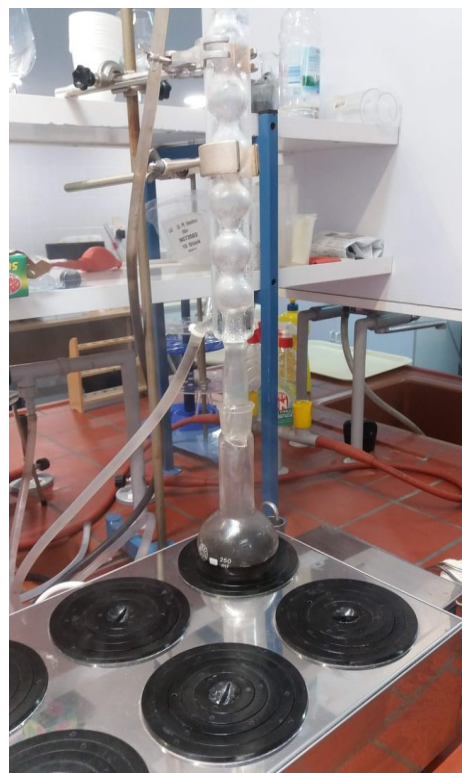
Slika 6. Kuhanje uzorka na vodenoj kupelji