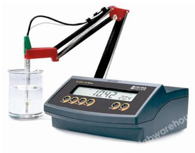
Slika 4. pH metar (Anonymus_2, URL)

pH metar je najprije potrebno kalibrirati uronivši elektrodu u standardnu otopinu pH 4 te zatim u standardnu otopinu pH 7. Nakon kalibracije elektroda se opere destiliranom vodom i osuši filter papirom te zatim uroni u vodeni ekstrakt mesa i izmjeri pH. Nakon mjerenja elektrodu je ponovno potrebno oprati destiliranom vodom.