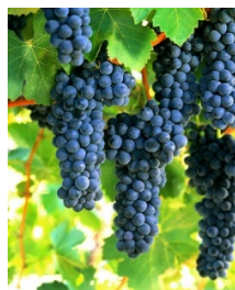
Slika 2. Izgled grožđa Syrah

Tipična je vinska sorta koja daje vina osrednje do visoke kakvoće, što ovisi o okolinskim uvjetima. Nakuplja 18-25% sladora, s ukupnom kiselošću od 6,0 do 8,0 g/l. Daje snažna, ekstraktivna, obojena vina prikladna i za kupažu. (Mirošević, Turković, 2009.)