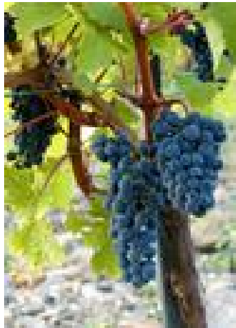
Slika 4. Izgled grožđa Cabernet Sauvignon

Gospodarska vrijednost ovisi o plasmanu dobro odnjegovanih vina u bocama, po cijenama koje mogu izjednačiti manjak mase prinosa. Prema tome je Cabernet sauvignon tipična sorta malih grozdova visoke kakvoće. Kao zobatica nije prikladan. (Mirošević, Turković, 2009.)