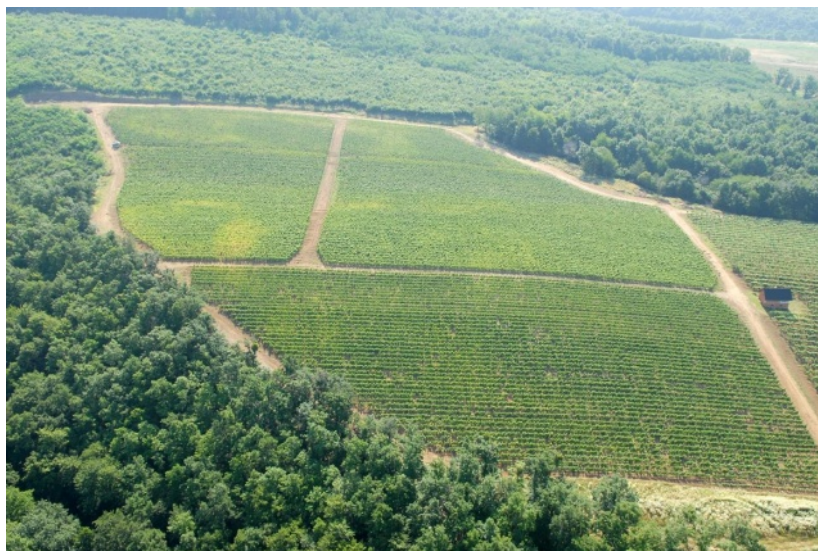
Slika 5. Vinogradi Vinarije Bartolović (crne sorte)

Sorte Syrah, Merlot i Cabernet Sauvignon zasađene su na površini od 3,56 hektara s tim da je na istoj parceli zasađen i Pinot crni na površini od 0,87 hektara, što bi ukupno bilo 4,43 hektara crnih sorti grožđa. Syrah je zasađen na površini od 1,29 hektara, Merlot na površini od 1,2 hektara i Cabernet Sauvignon na površini od 1,07 hektara. Uzgojni oblik je Guyot, jedan od najpopularnijih uzgojnih oblika kontinentalne Hrvatske zbog jednostavnijeg održavanja i lakšeg pristupa mehanizaciji. Sve crne sorte vinove loze zasađene su na podlozi SO4. Nakon berbe prikupljani su podaci količine šećera i kiselina u moštu te krajnja analiza vina, gdje je svako vino ocijenjeno vrhunskom ocjenom.