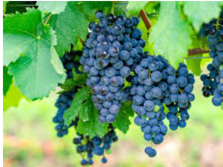
Slika 3. Izgled grožđa Merlot

Po kakvoći vino zaostaje za Cabernetima i Pinotom crnim, ali je ipak natprosječne vrijednosti. Sadržaj alkohola srednji, boja kao rubin crvena. U srednjoj Slavoniji imalo je vino te sorte grožđa u 15-godišnjem prosjeku 17,1% šećera po Klost. (od 14,0 do 20,0). Preporučuje se za područja u kojima može nadomjestiti vrijedne crne sorte. (Mirošević, Turković, 2009.)