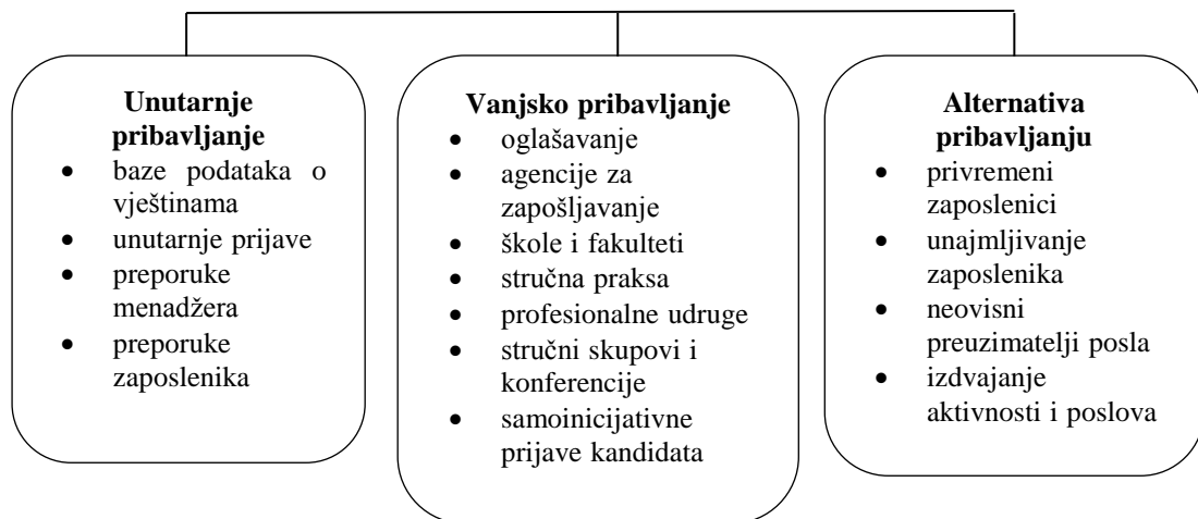
Slika 1.: Mogućnost pribavljanja talenata

Prilagođeno prema: Bahtijarević-Šiber, 2014:185