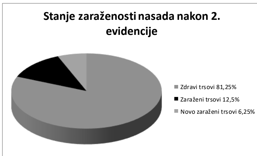
Grafikon 2. Stanje zaraze (%) nakon druge evidencije

Prilikom druge evidencije i kontrole saniranih trsova zabilježena je pojava 250 novo zaraženih trsova, a od 500 saniranih trsova 47 nakon sanacije ne pokazuju razvoj novih tumorsnih izraslina dok se na 453 trsa razvijaju nove tumorsne izrasline usprkos provedenoj sanaciji.