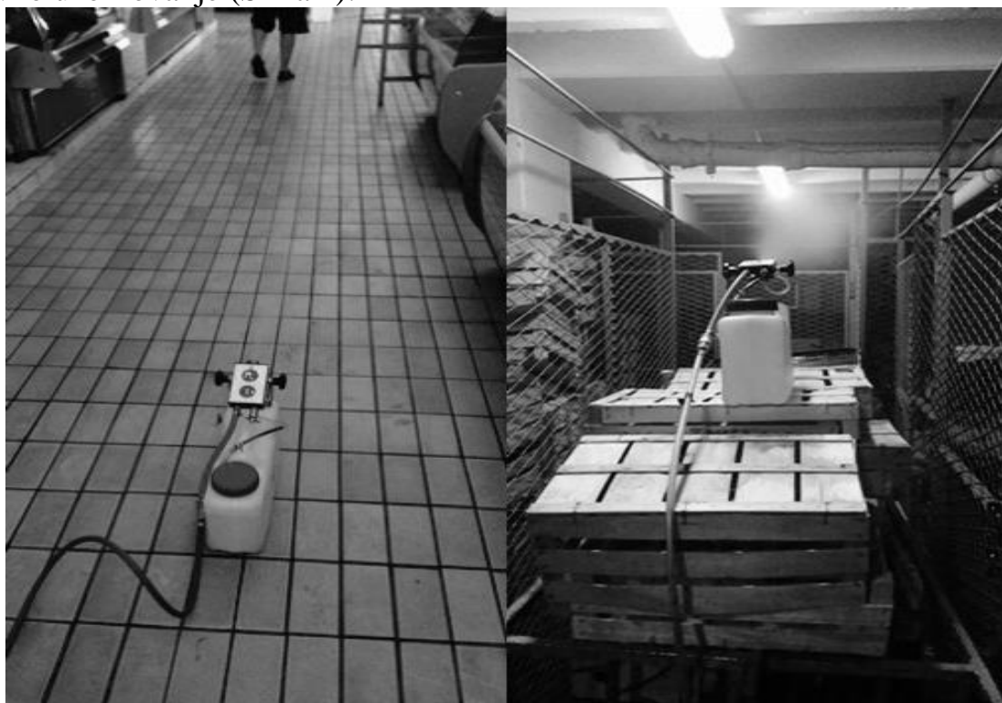
Slika 2. Tretiranje poslovnih prostora i skladišta „Akacidom“

Na početku istraživanja određeno je „nulto stanje“, a nakon njega izvršeno je tretiranje zraka s dezinfekcijskim sredstvom „Akacidom“ u trajanju od dva sata, te ponovno uzorkovanje (Slika 2).