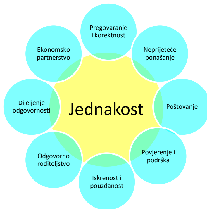
Slika 2. Nenasilnički odnos