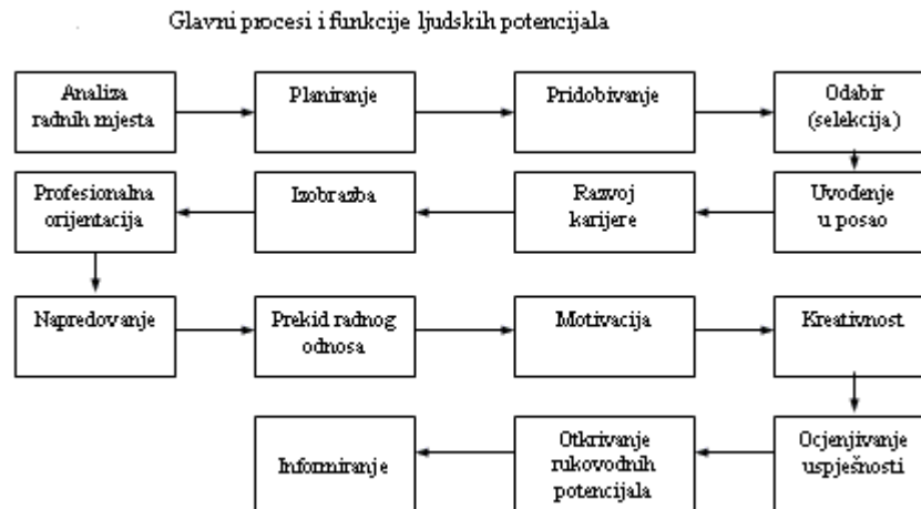
Slika 2: Glavni procesi i funkcije ljudskih potencijala

http://www.poslovniforum.hr/management/upravljanje_ljudskim_potencijalima.asp