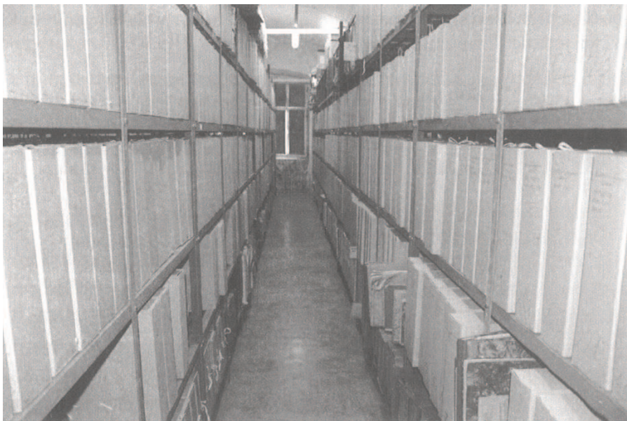
Slika 4. Prostorija sa sređenim i tehnički opremljenim arhivskim gradivom

Većina dokumenta u uredskom poslovanju u današnjici se stvara na papiru dok su se u razdoblju od 1850. godine stvarali na kiselom papiru i zbog toga su nekadašnji dokumenti sve više težili propadanju. Zbog toga je važno da svaka ustanova danas dokumente izrađuje na alkaličnom papiru koji se smatra dugovječnim i postojanim, a osim toga je dobro da se takvi dokumenti čuvaju unutar spremnika kao što su korice, omoti, kutije i registratori. Kako današnji arhivi čuvaju sve više slika, činjenica nalaže da ih je potrebno dobro i zaštititi kako bi njihov vijek opstao što duže. Prema tome, gradivo poput slika, fotografija, filmova i mikrofilmova potrebno je čuvati na temperaturi od 19-22 °C, a fotografije u boji na temperaturi od 16-18 °C, dok bi se vlažnost zraka trebala kretati oko 35%. Kako bi prostor unutar kojeg se čuva arhivsko gradivo bio štoviše djelotvoran, poželjno je temperaturu i vlažnost provjeravati svakoga dana.