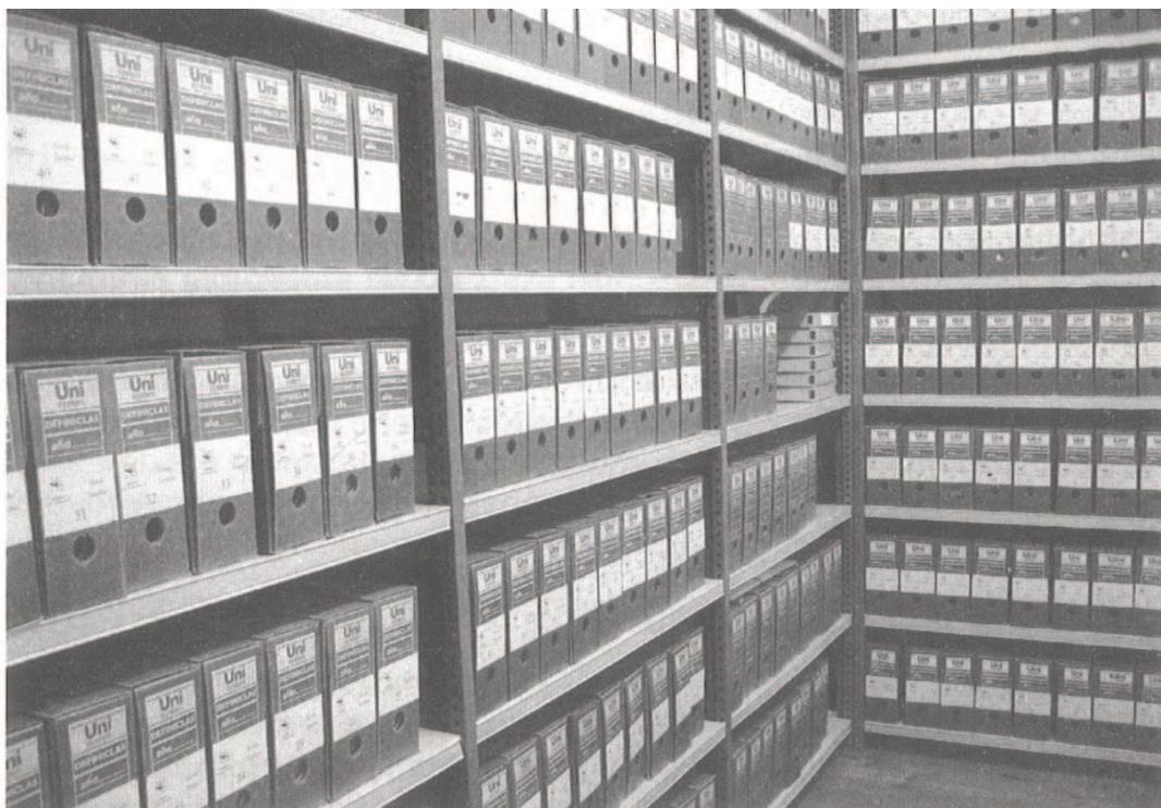
Slika 2. Izgled prostora pismohrane kod imatelja sa složenim arhivskim i registraturnim gradivom