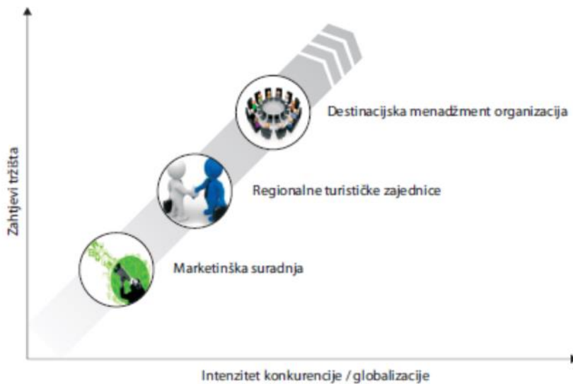
Slika 3. Povijesni razvoj modela upravljanja turizmom