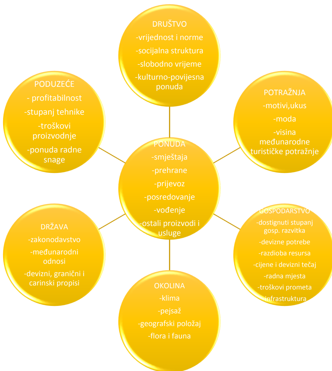
Slika 1. Čimbenici koji utječu na turističku ponudu (Pirjevec, 1998:130)