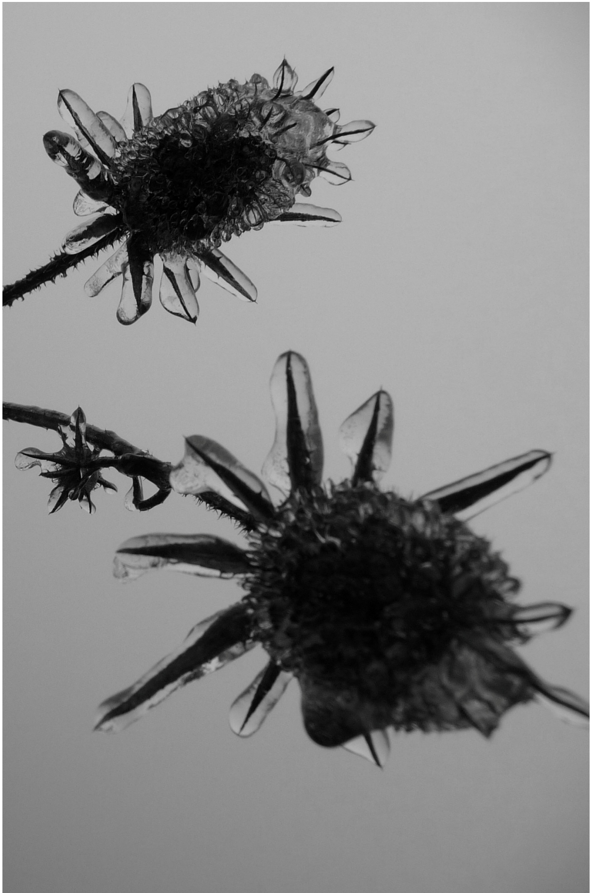
Photo 026. Ice / Led