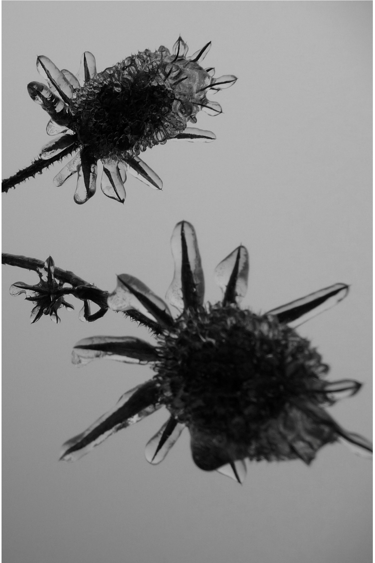
Photo 026. Ice / Led