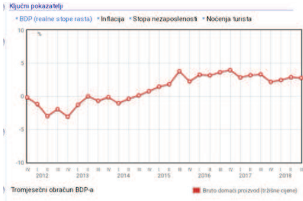
Grafikon br. 1: Tromjesečni obračun BDP-a