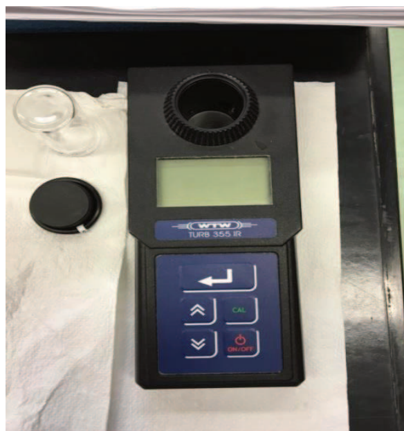
Slika 8. Turbidimetar

Prije početka rada turbidimetar se kalibrira. Uzorak vode se promućka, a zatim ulije u turbidimetrijsku kivetu. Mutnoća se direktno očitava sa skale uređaja. Rezultat je prikazan u nefelometrijskim jedinicama.