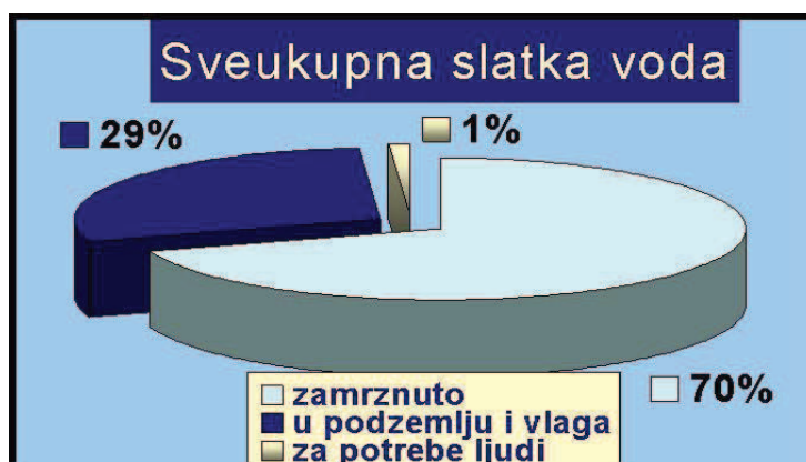
Slika 1. Sveukupna slatka voda na kopnu (Voda za život, n.d., URL)

Rast stanovnika, gospodarski razvoj i urbanizacija doveli su do povećane proizvodnje hrane i industrijskih proizvoda, a to dovodi do povećanja otpadnih tvari i energije. Razvoj kemijske industrije uzrokovao je pojavu umjetnih tvari i spojeva kojih nikada nije bilo u prirodi. Razvoj čovječanstva doveo je, kako do velikog porasta potreba za vodom, tako i do ugrožavanja vodnih resursa i vodnog okoliša što vodu može pretvoriti u ugrozu ljudskog zdravlja. U razvijenim zemljama briga o očuvanju i unaprjeđenju kakvoće vode uključena je u svim djelatnostima i sastavni je dio svake odluke o planiranom razvoju. S druge strane, zemlje u razvoju, koje su raspolagale sa razmjerno velikim količinama prirodno čistih voda i očuvanim okolišem, mjere za zaštitu voda smatraju ograničavajućim faktorom gospodarskog razvoja. Ljudska aktivnost glavni je uzrok onečišćenja kopnenih voda. Nemaran odnos prema okolišu i vodi, ispuštanje štetnih otpadnih tvari u prijemnike i okoliš, izaziva negativne promjene u hidrosferi koje mogu dovesti do ugrožavanja biološke raznolikosti, teških poremećaja ekosustava te općenito ozbiljniji zdravlju, napretku i razvoju cjelokupnog života na Zemlji (Jerković, 2015: 4-5).