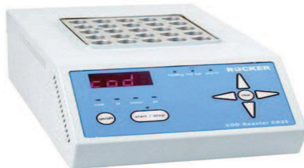
Slika 9. COD reaktor za određivanje KPK (Anonymous_5, URL)

zatvorene kivete COD reaktora, a količina utroška kisika mjeri se spektrofotometrom. Ako je rezultat izvan mjernog područja, potrebno je ponoviti analizu u razrijeđenom uzorku. Rezultat se izražava u mg O 2 /L.