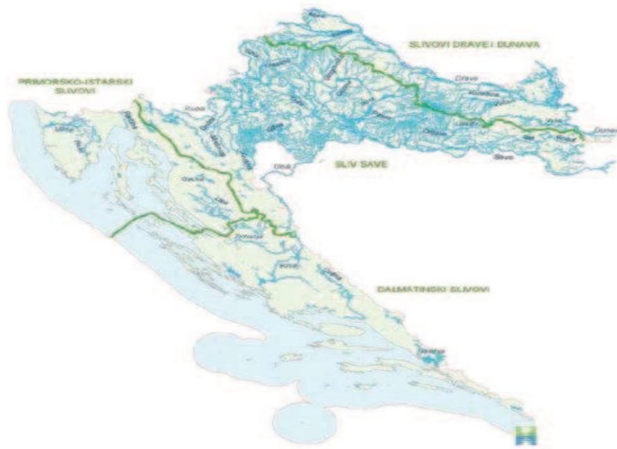
Slika 3. Veći vodotoci i slivovi na području Hrvatske (Strategija upravljanja vodama, 2009: 9, URL)