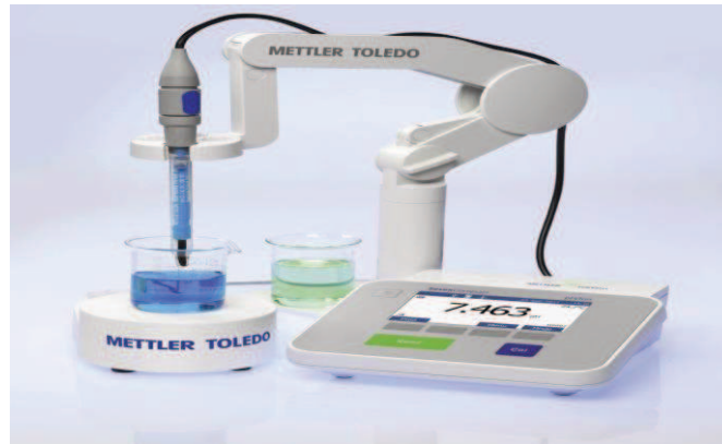
Slika 6. pH metar

nakon toga, uzorkom. Elektroda se tada uroni u čašu s uzorkom, pričekava da se sustav stabilizira i očita pH vrijednost. pH vrijednost se izražava na dvije decimale, uz obavezno navođenje temperature pri kojoj je izvršeno mjerenje. Između dva ili više mjerenja, elektrode se drže uronjene u destiliranu vodu.