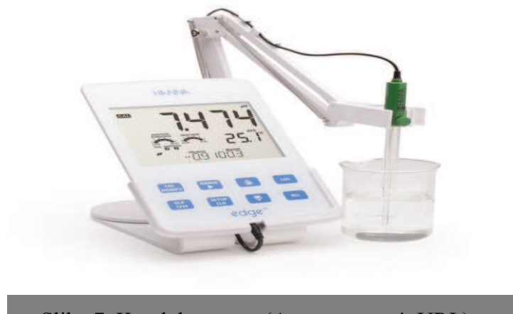
Slika 7. Konduktometar

Električna provodljivost se mjeri pomoću konduktometra. Provodljivost ovisi o prisutnosti ioniziranih i otopljenih tvari u vodi, njihovoj koncentraciji, pokretljivosti i valenciji. Konduktivitet pomaže u određivanju kvalitete slatke vode za različite namjene i vrlo je česti mjereni pokazatelj. Prije početka mjerenja uređaj je potrebno kalibrirati puferom. Za precizno određivanje mjerenje se provode pri temperaturi od 25 °C sa mogućnošću odstupanja od \pm 0,1 °C.