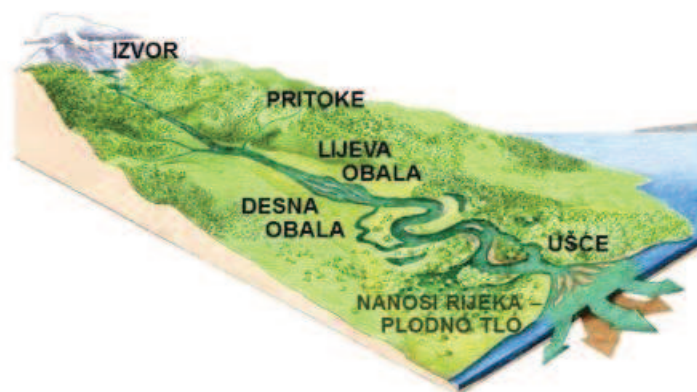
Slika 2. Što je rijeka (Rijeke Hrvatske, n.d., URL)

Osnovni dijelovi rijeke su: izvor, ušće, pritok, riječno korito i obala. Izvor je mjesto na površini kopna na kojem stalno ili povremeno izbija podzemna voda. Izvori iz krškog podzemlja zovu se vrela. Ušće je mjesto gdje se tekućica ulijeva u jezero, more ili drugu tekućicu. Pritok je tekućica koja utječe u drugu, veću tekućicu. Riječno korito je žljebasto udubljenje na površini zemlje kojim teče voda. Obala je dio riječnog korita koji se nalazi iznad razine vode u rijeci. Desna i lijeva strana riječne obale određuje se prema smjeru otjecanja. Korito rijeke tipično sadrži jednu struju vode, ali neke rijeke teku kao nekoliko međusobno povezanih struja vode, stvarajući spletnu rijeku. Rijeka koja teče u svom koritu je izvor energije koji djeluje na samo korito, na način da mijenja oblik i formu. Kroz tok rijeke ukupni volumen vode koji se prenosi nizvodno, često je kombinacija slobodnog protoka zajedno s znatnim volumenom koji teče podlogom površine stijena i šljunka kojima je pokriveno dno (Pivac, 2014: 19).