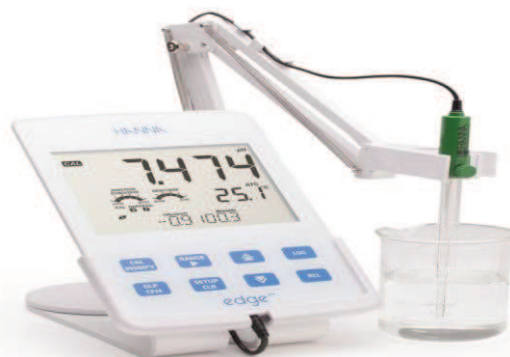
Slika 7. Konduktometar (Anonymous_4, URL)

Električna provodljivost se mjeri pomoću konduktometra. Provodljivost ovisi o prisutnosti ioniziranih i otopljenih tvari u vodi, njihovoj koncentraciji, pokretljivosti i valenciji. Konduktivitet pomaže u određivanju kvalitete slatke vode za različite namjene i vrlo je česti mjereni pokazatelj. Prije početka mjerenja uređaj je potrebno kalibrirati puferom. Za precizno određivanje mjerenje se provode pri temperaturi od 25 °C sa mogućnošću odstupanja od \pm 0,1 °C.