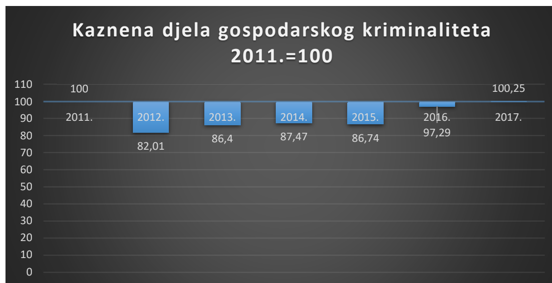
Grafikon 2: Bazni indeksi ukupnih kaznenih djela gospodarskog kriminaliteta u Republici Hrvatskoj