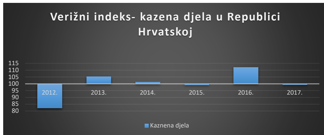
Grafikon 1: Verižni indeksi ukupnih kaznenih djela gospodarskog kriminaliteta u Republici Hrvatskoj u razdoblju od 2011. do 2017. godine