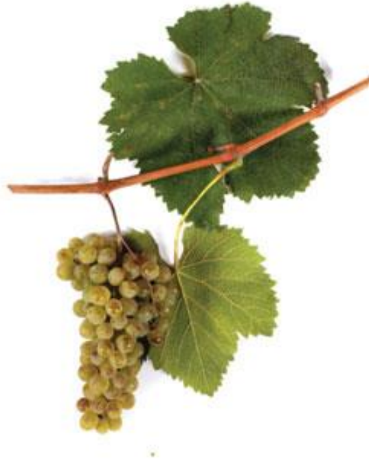
Slika br 4: Sorta Kisi