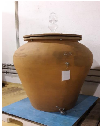
Slika br.10: Slika prikazuje amforu u podrumu vinarije Krauthaker. (12.03.2018.)

Proizvodnjom Kuvlakhe vina vinarija Krauhaker počela je 2009.godine te ih proizvode sve do sada, naravno ukoliko to vinogradarska godina omogućava. Od samih početaka maceracija se odvijala u inoks tankovima, ali kako se unaprijeđivala tehnika proizvodnje tako su se unaprijeđivala i sredstva proizvodnje, što znači da se maceracija sad odvija u glinenim amforama.