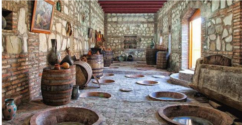
Slika br.7: Slika prikazuje kvevri ukopane u zemlju. ( Anonymous, 14.03.2018.url )