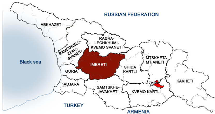
Slika br. 3 Regija Imereti oznčena crvenom bojom ( Anonymous, 15.01.2018. url )