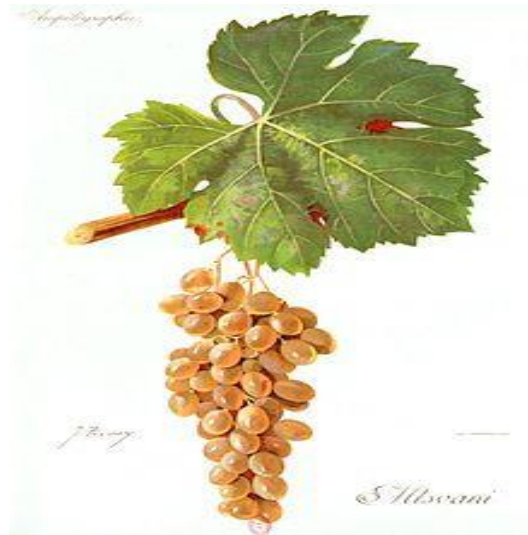
Slika br. 5: Sorta Mtsvane