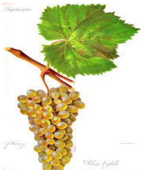
Slika br. 7: Grozd sorte rkatsiteli