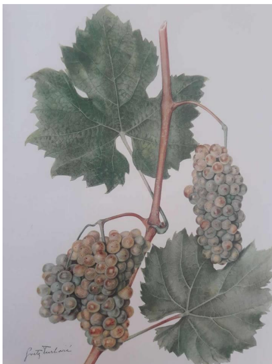
Slika br.11: Sorta Graševina ( Mirošević i Turković, 2003. )

Vino sorte Graševine je žuto zelene boje, izraženog mirisa, suhog okusa, srednjeg sadržaja alkohola i ekstrakta, ugodno gorkasto i već kao mlado vino razvija sortni miris i aromu istaknute svježine. ( Anonymous, 5.3.2018. url )