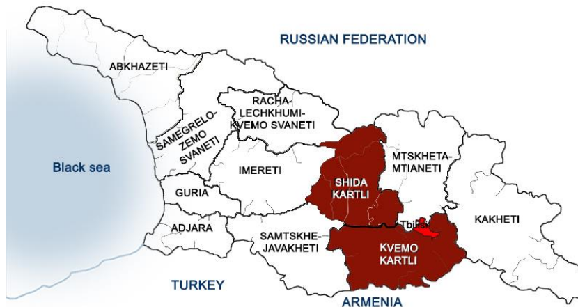
Slika br. 2: Regija Kartli označena crvenom bojom