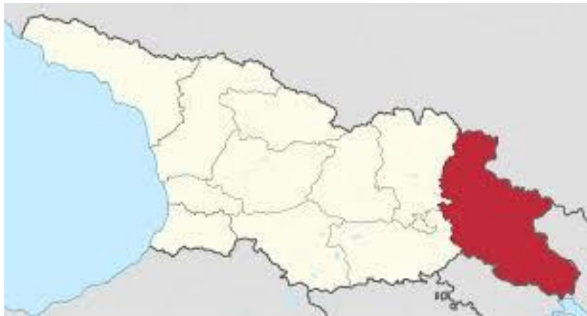
Slika br.1: Regija Kakheti, označena crvenom bojom ( Anonymous, 15.01.2018. url )

Kakheti je regija na istoku Gruzije. Okružena je Rusijom na sjeveru i sjeveroistoku, zatim Azerbajdžanom na istoku, jugoistoku te jugozapadu te regijom Kartli na zapadu. Najveći i glavni grad je Telavi. Dolina Alazana smještena je između dvije glavne rijeke regije, jedna je - Alazani, a druga je - Iori. Rijeka Iori teče od zapada prema istoku i stvara nizinu Iori. Ta dva područja, dvije rijeke i dvije doline uzrokuju poljoprivredne proizvodne karakteristike i potencijal Kakheti regije, razlikuje Kakheti regiju od ostalih područja Gruzije. Klima je vlažna suptropska te kontinentalna. Prosječna temperatura zimi je oko 0 ° C; Ljeti doseže + 23-30 ° C. Kakheti je poljoprivredna regija, a glavna djelatnost je vinogradarstvo. Te u regiji je zabilježeno oko 80 sorti vinove loze (, Anonymous, 15.01.2018. url )