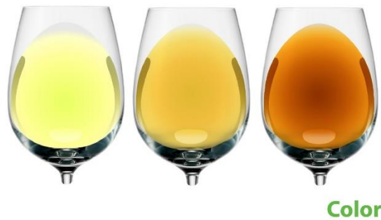
Slika br. 8: Razlika boje između klasične i kvevri proizvodnje vina ( Anonymous, 23.2.2018. url )