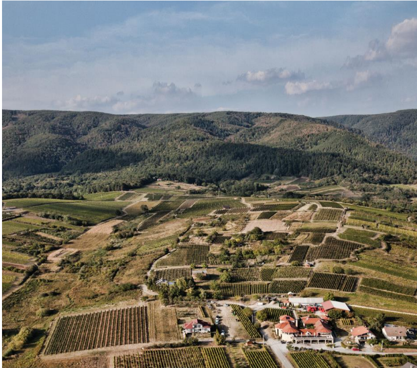
Slika br.9: Vinogorje Kutjevo