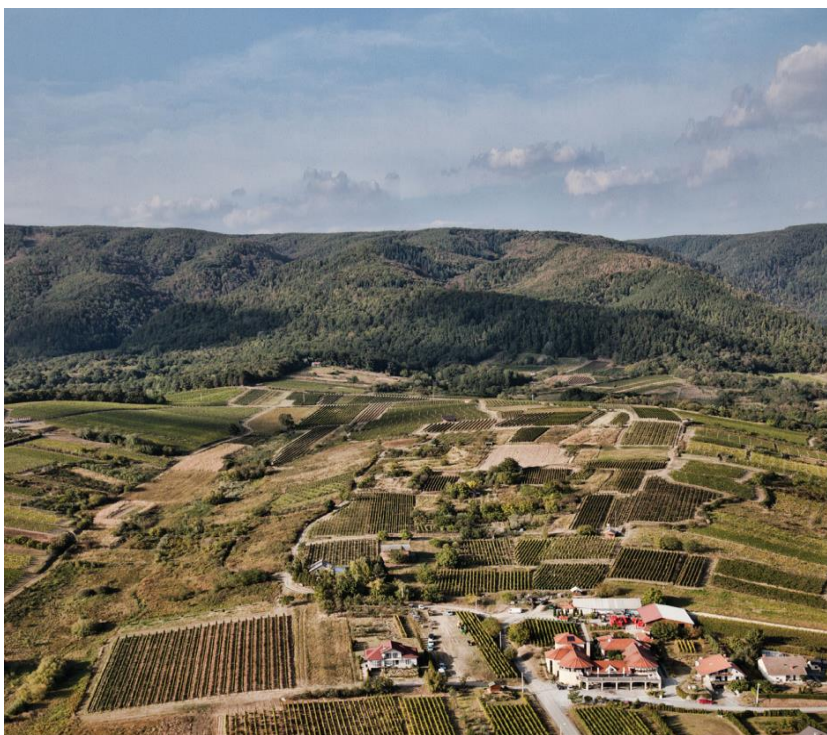
Slika br.9: Vinogorje Kutjevo ( Anonymous, 3.3.2018.url )