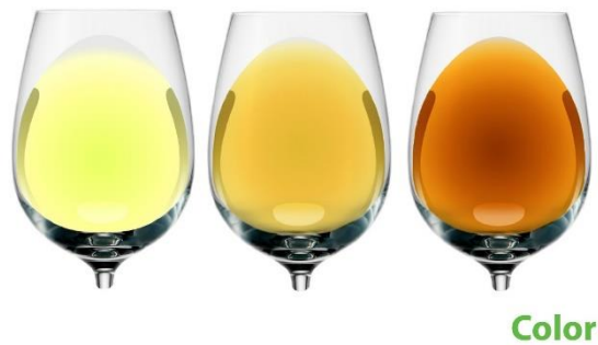
Slika br. 8: Razlika boje između klasične i kvevri proizvodnje vina ( Anonymous, 23.2.2018. url )