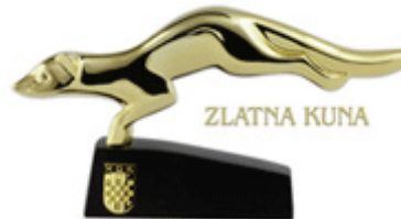
Slika 9. Priznanje za najuspješnije trgovačko društvo u županiji u 2008.