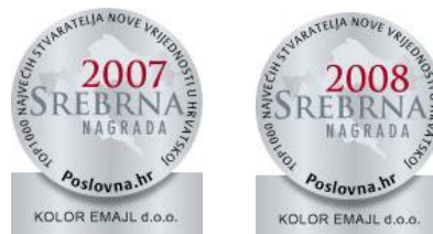
Slika 11. Srebrna nagrada - među top 1000 poslovnih subjekata u RH