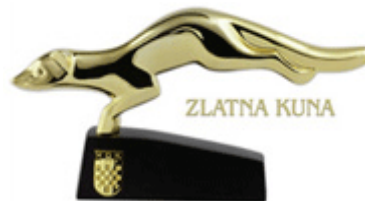
Slika 9. Priznanje za najuspješnije trgovačko društvo u županiji u 2008.