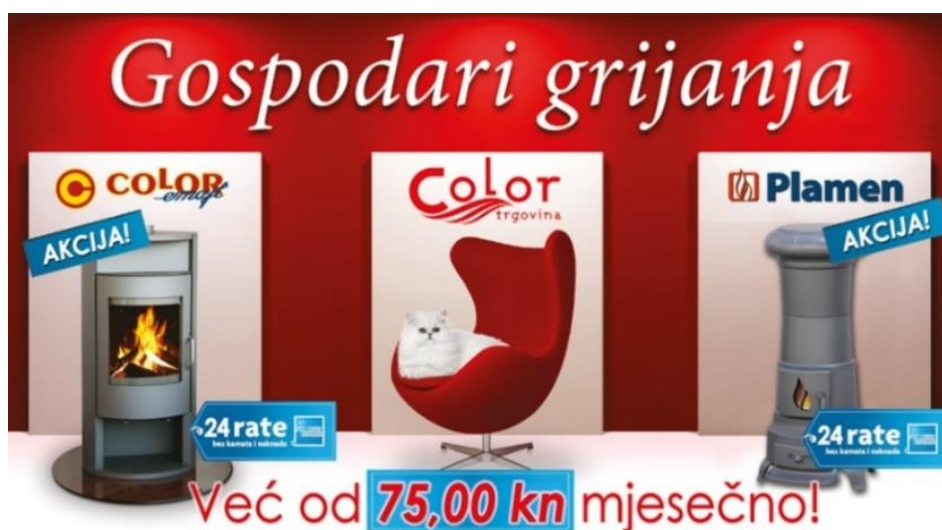
Slika 19. Promotivni plakat Color trgovine