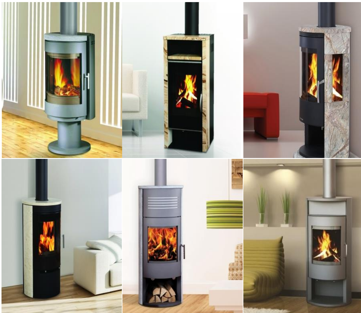
Slika 4. Dio proizvodnog programa – kamini