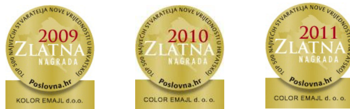
Slika 10. Zlatna nagrada - među top 500 poslovnih subjekata u RH