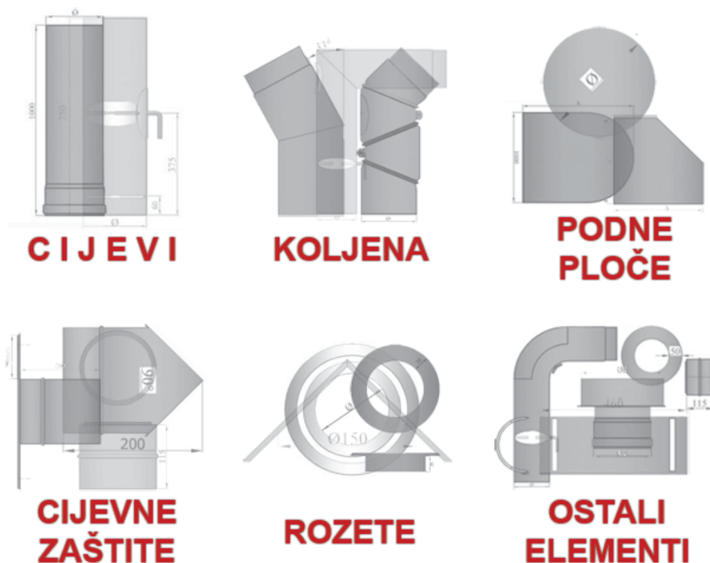
Slika 7. Dimovodni elementi

Dimovodni elementi su proizvedeni prema visokim ISO 9001 standardima. Proizvodni pogon je organiziran u skladu sa ISO 9001 procesima. Konstantna kontrola procesa ISO 9001 pozicionira Color emajl d.o.o. među najkonkurentnije proizvođače u Srednjoj Europi. Kroz godine Color emajl d.o.o. je uspostavio dobre veze sa svojim dobavljačima što pridonosi vrhunskoj kvaliteti proizvoda. Lim je osnovni sastojak dimovodnih elemenata, te je njegova kvaliteta konstantno kontrolirana s namjerom očuvanja vrhunske kvalitete. U pogonima Color emajla d.o.o. se godišnje preradi oko 6,5 tisuća tona lima, i jedan su od najvećih proizvođača dimovodnih cijevi u Europi.