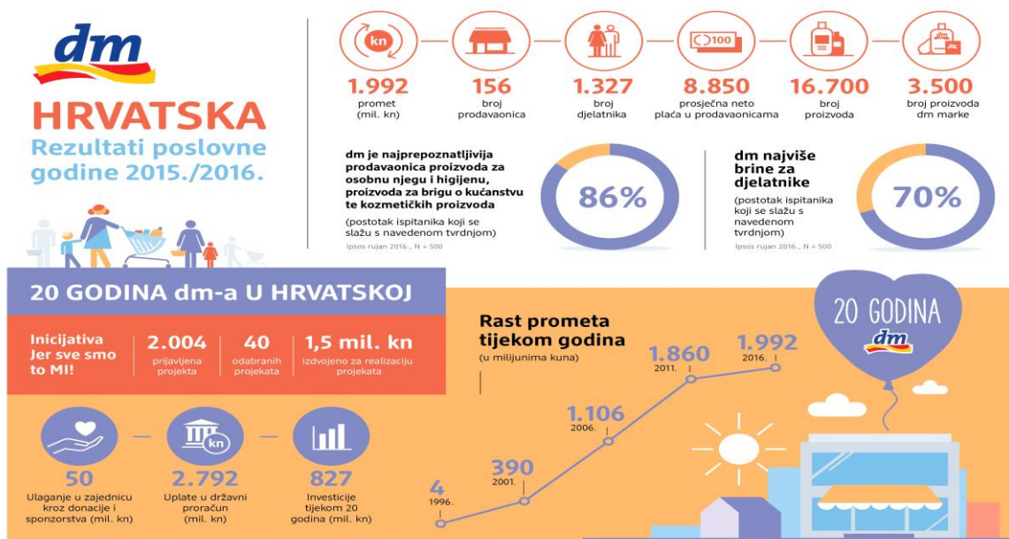
Slika 5 Pregled poslovanja DM-a

Prema istraživanju agencije Ipsos Plus prodavaonice DM-a prvi su izbor kupovine kozmetike i zdrave hrane. Jedan od razloga takvog rezultata jest sigurno i jedinstven koncept kupnje koji je sažet u poruci „Tu sam čovjek“. Kupci su u Dm prodavaonicama prepoznali odličan omjer cijene i kvalitete, filozofiju poslovanja koja je okrenuta čovjeku, stavivši čovjeka i njegove potrebe u centar. Svojim kupcima DM nudi kvalitetnu uslugu, povoljniju kupnju, iznimno kvalitetne vlastite robne marke, dostupnost i blizinu, ali i mogućnost aktivnog uključivanja u društveno odgovorne projekte.