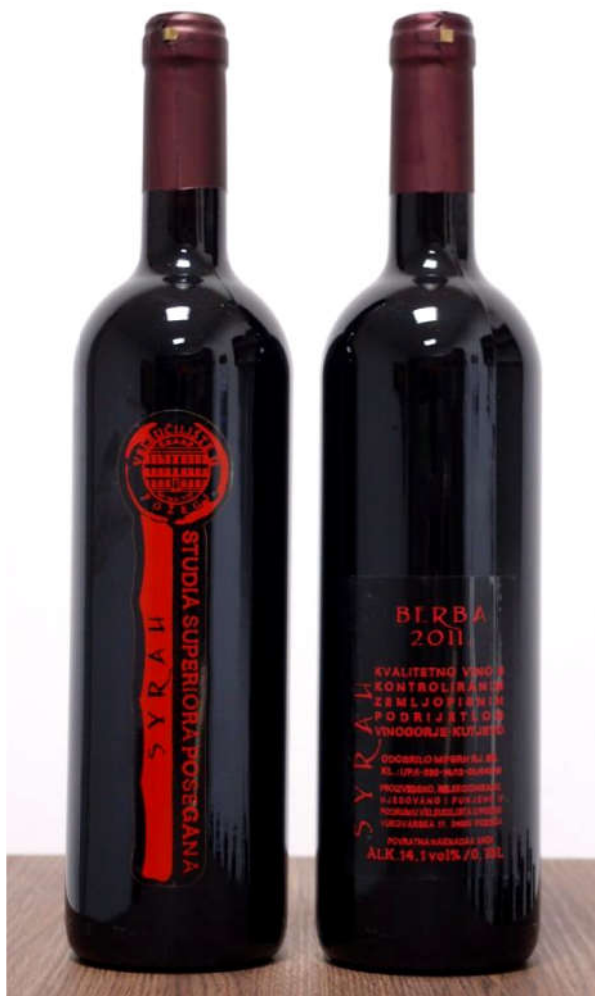
Slika 3. Vino Syrah, Veleučilišta u Požegi