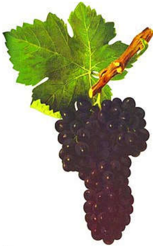
Slika 2. Izgled grožđa Syrah (upload.wikimedia.org)

blago crvenkasto nijansiranom. Peteljka lista je duga, tanka, zupci srednji do veliki. Zreo grozd je srednje velik, cilindričan, najčešće izdužen, kompaktn, do koljenaca odrvenjele izdužene peteljke. Zrele bobice su okrugle do ovalne, srednje velike do malene, izrazito tamnoplave obojene s obilnim peteljkom. Meso je sočno, slatko i užitno. Rozgva je rebrasto uglasta, srednje dugih članaka kestenjastocrvenkastih i tamnije nijansiranih koljenaca. Rast je srednje bujnosti, dobar. (Mirošević, N., Turković, Z. 2003.)