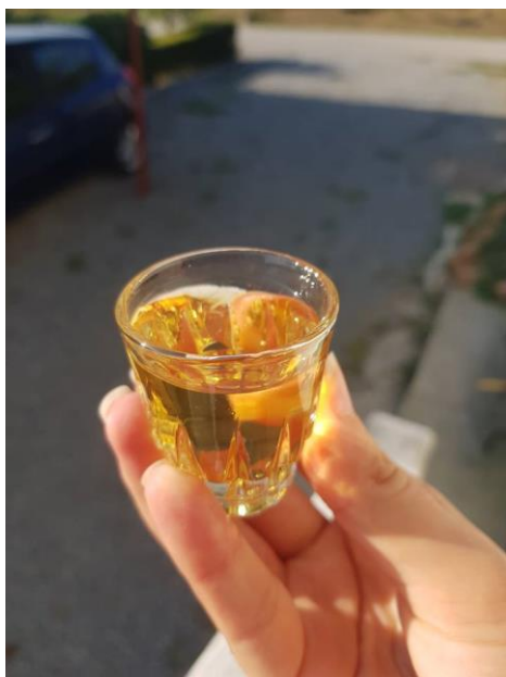
Slika 3. Rakija