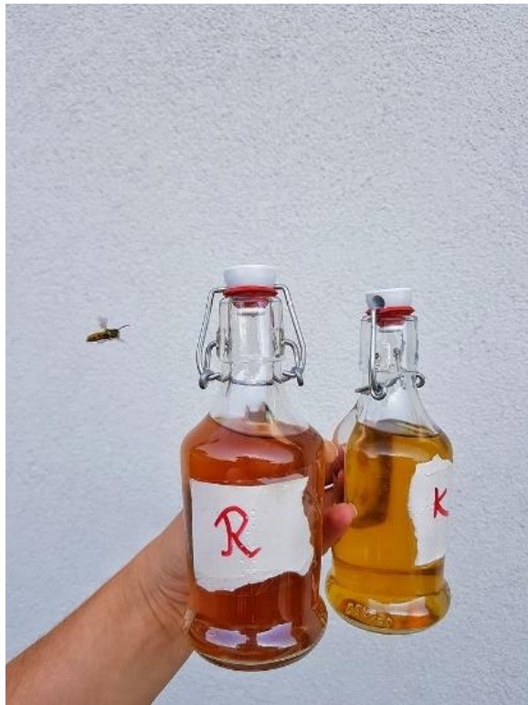
Slika 11. Liker od rogača i liker od kadulje.

Kada se usporede ove dvije tablice vidljivo je da su boja i bistroća jednako ocijenjene, dok miris kod likera od kadulje ima bolje ocjene, a okus znatno bolju ocjenu. Čak 67,5 bodova više dobio je liker od rogača za okus.