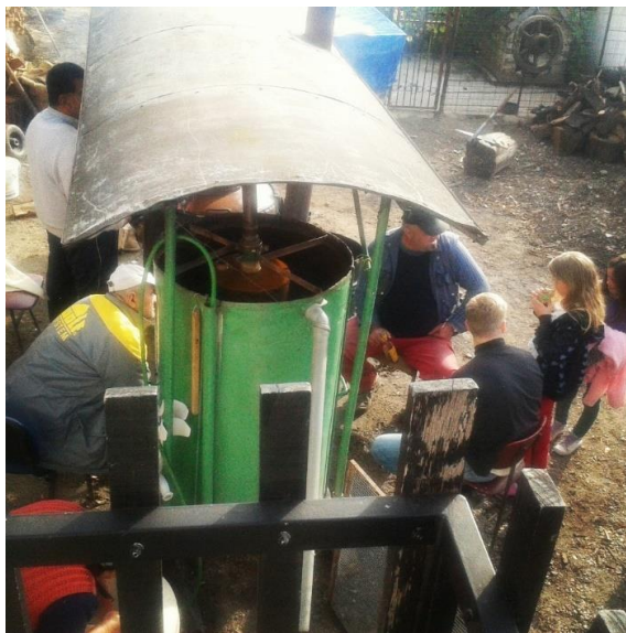
Slika 3. - Stroj za pečenje rakije

Osnovni dijelovi klasičnog, uređaja za pečenje rakije su: kotao s dijelom za destilaciju i dijelom za zagrijavanje, kapa, klobuk ili poklopac (gornji dio kotla), cijev od poklopca do hladila, i hladilo s predloškom.