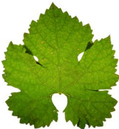
Slika 2. Izgled lista sorte Merlot ( Izvor Wine Blog, 11.04.2016., URL )