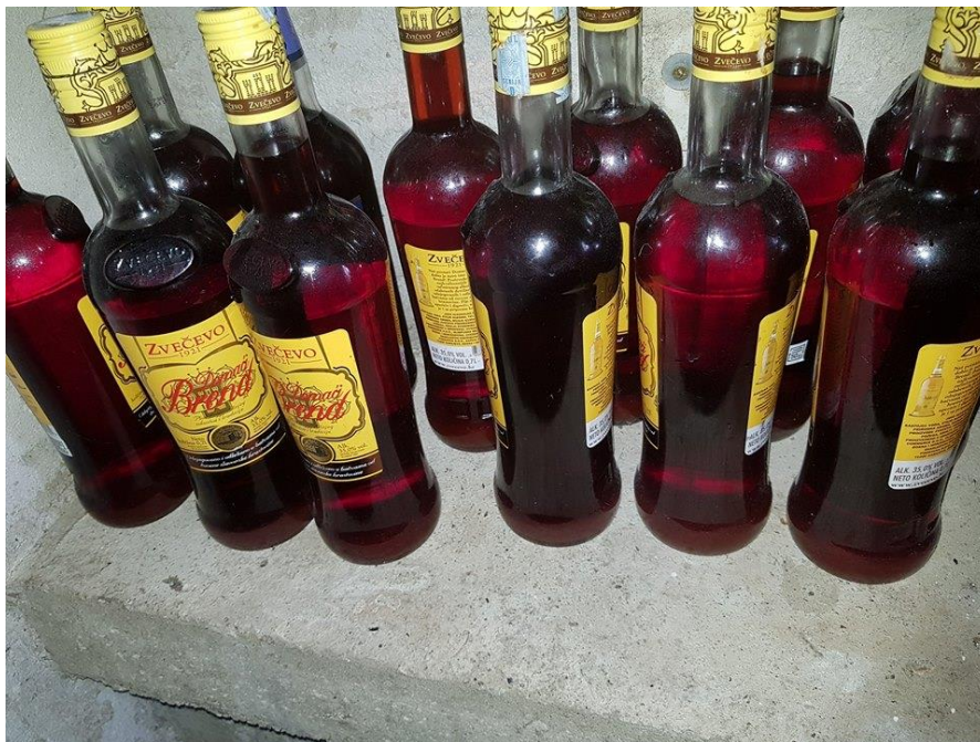
Slika 7. – liker od višanja