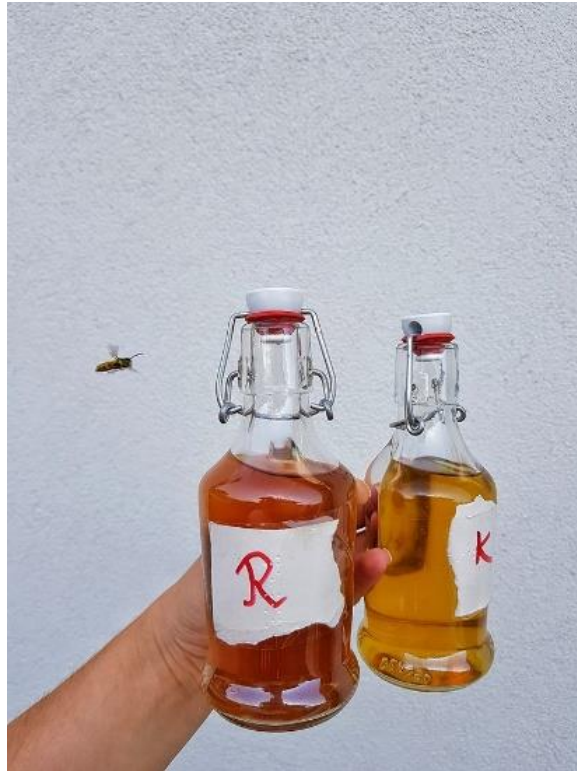
Slika 11. Liker od rogača i liker od kadulje.

Kada se usporede ove dvije tablice vidljivo je da su boja i bistroća jednako ocijenjene, dok miris kod likera od kadulje ima bolje ocjene, a okus znatno bolju ocjenu. Čak 67,5 bodova više dobio je liker od rogača za okus.