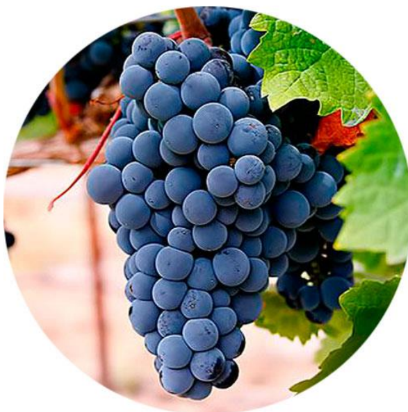
Slika 1. Izgled grozda sorte Merlot