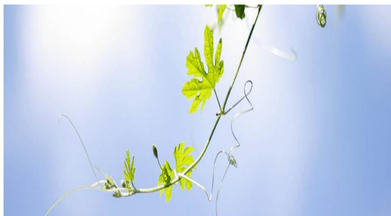
Slika 3. Vitice vinove loze