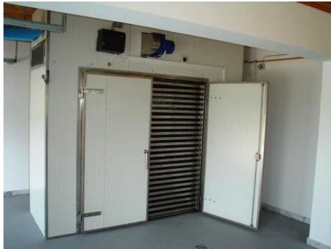
Slika 7. Komorna sušnica za voće (Izvor: Anonymus_7, 20.06.2017., url)

Može biti zidana ili izgrađena od metalnih ploča u kojima je tvar koja se suši poredana u lijese. Lijese su postavljene na vagonete. Sušenje se obavlja zrakom kojega u sušaru tlači jedan, a iz sušare odsisava drugi ventilator. Zrak se prethodno grije u kaloriferu, a zatim se ventilatorom tlači između donje trećine lijesa. Nedostatak je ovih sušara u tome: što sušenje traje relativno dugo (jer tvar miruje za vrijeme sušenja), imaju mali učinka, tvar se nejednoliko suši, utrošak radne snage je velik (jer se tvar na lijese stavlja ručno), ovisno o tvari sušenje traje oko 4 ili više sati (Sušenje, 20.06.2017., url).