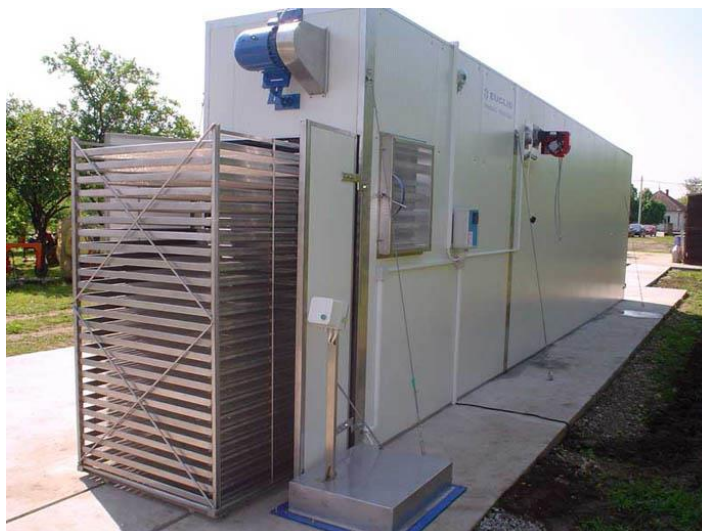
Slika 8. Tunelska sušnica za voće