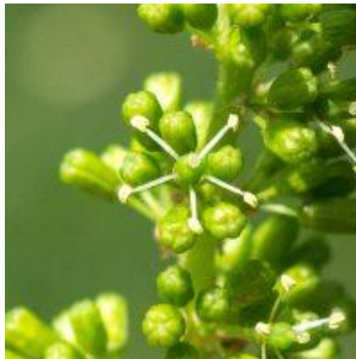
Slika 2. Cvijet vinove loze