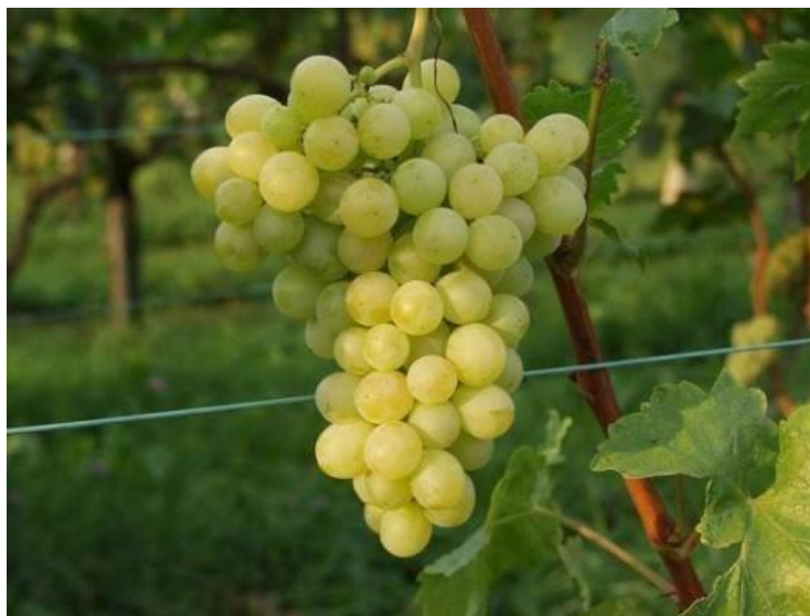
Slika 4. Grozd vinove loze

Podjela prema zbijenosti: - Vrlo zbijen grozd: bobice toliko zbijene da se izobliče - Zbijen grozd: bobice su zbijene i ne razmiču se jedna od druge - Rastresit grozd: grozd mijenja svoj oblik razmicanjem bobica - Vrlo rastresit grozd: bobice su međusobno udaljene