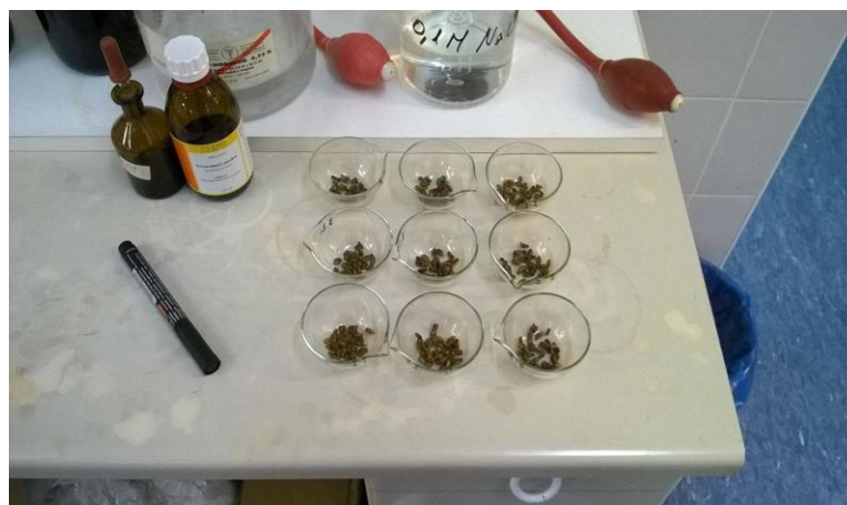
Slika 14. Sjemenke nakon sušenja