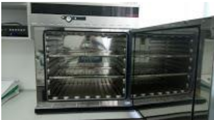
Slika 9. Laboratorijska sušara Memmert

Postupak sušenja bobica se provodio u laboratorijskoj sušari marke Memmert. Ova laboratorijska sušara se sastoji od tri kata koji su rešetkastog oblika. Na vrhu se nalaze upuhivači toplog zraka, dok rešetke omogućuju ravnomjernu raspodjelu strujanja zraka na svim katovima te ujednačeno sušenja uzoraka. Sušenje se provodilo do konstantne mase koja je najpreciznija metoda određivanja suhe tvari, a temelji se na principu isparavanja vode iz uzorka za analizu na temperaturi od 104° C u vremenskom periodu od 4 sata.