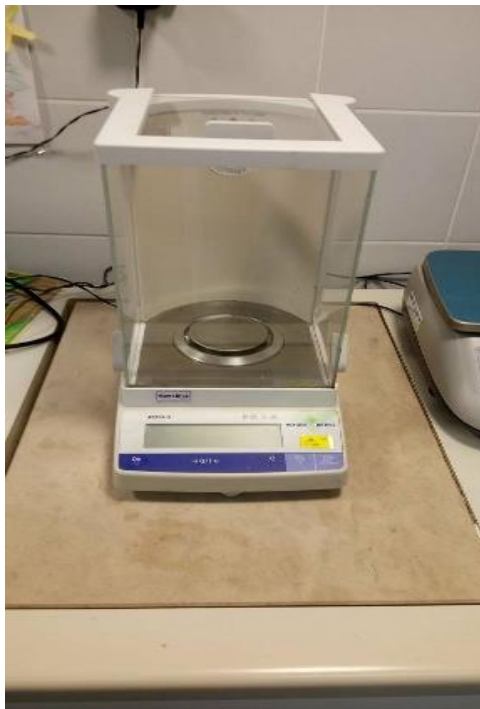
Slika 10. Analitička vaga Monobloc AB204-S

Postupak pokusa je išao tokom da su se prvo u vinogradu ubrali plodovi sorte Cabernet sauvignon, te su se preko noći držali u hladnjaku kako ne bi došlo do kvarenja i truljenja plodova. Zatim se pristupilo brojanju bobica koje smo podijelili u tri različite posude sa 100 bobica te se pristupilo vaganju. Za vaganje se koristila analitička vaga Monobloc AB204-S za precizno određivanje mase stvari koja je nosivosti 100 g i osjetljivosti 0.1 mg. Ona je smještena u stakleni ormarić koji ju štiti od prašine i zračnih struja koje bi mogle poremetiti položaj ravnoteže. Stalak vage pričvršćen je na debelu kamenu ploču kako bi se umanjile vibracije. Te se još koristila i trgovačka Mini-Tiger vaga nosivosti 6 kilograma.