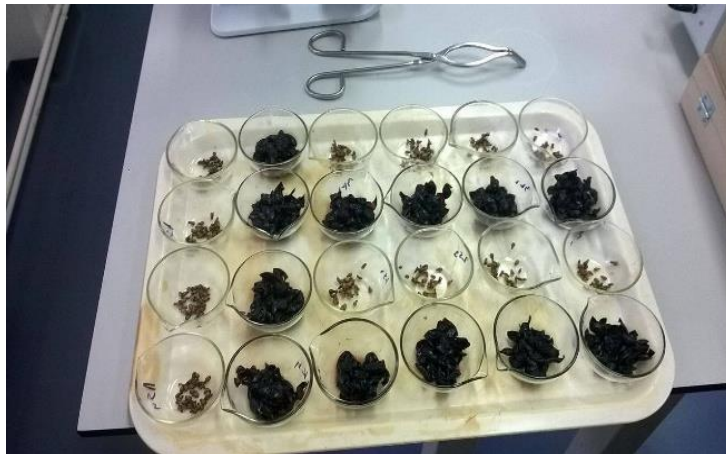
Slika 13. Pripreme za sušenje

Uzorci su podijeljeni u tri posude s po 100 bobica, te je još dodatno svaka ta posuda sa 100 bobica podijeljena na tri manje posudice sa po 33, 33 i 34 bobice zbog lakšeg sušenja te zbog veće i pouzdanije količine podataka.