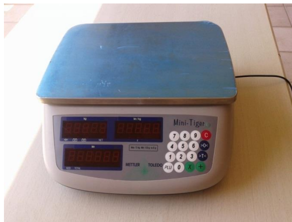
Slika 11. Trgovačka Mini-Tiger vaga (Vlastiti izvor)