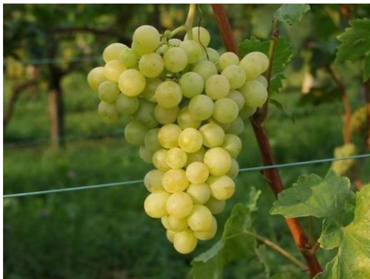
Slika 4. Grozd vinove loze

Podjela prema zbijenosti: - Vrlo zbijen grozd: bobice toliko zbijene da se izobliče - Zbijen grozd: bobice su zbijene i ne razmiču se jedna od druge - Rastresit grozd: grozd mijenja svoj oblik razmicanjem bobica - Vrlo rastresit grozd: bobice su međusobno udaljene