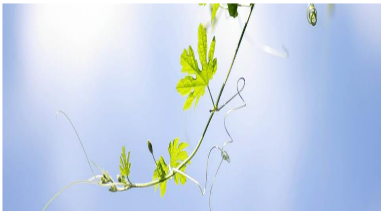
Slika 3. Vitice vinove loze (Izvor Anonymus_3, 16.06.2017., url)