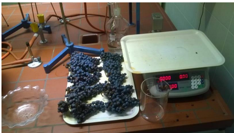
Slika 12. Vaganje bobica

U pokusu se pristupilo vaganju bobica koje su podijeljene u tri različite posude po 100 bobica. Tim mjerenjem dolazimo do podatka mase 100 bobica i mase jedne bobice. Najprije se izvaži i zapiše masa prazne posude, te potom masa pune posude, a razlika je masa 100 bobica, a za dobivanje prosječne mase jedne bobice smo podijelili ukupnu masu 100 bobica s brojem bobica.