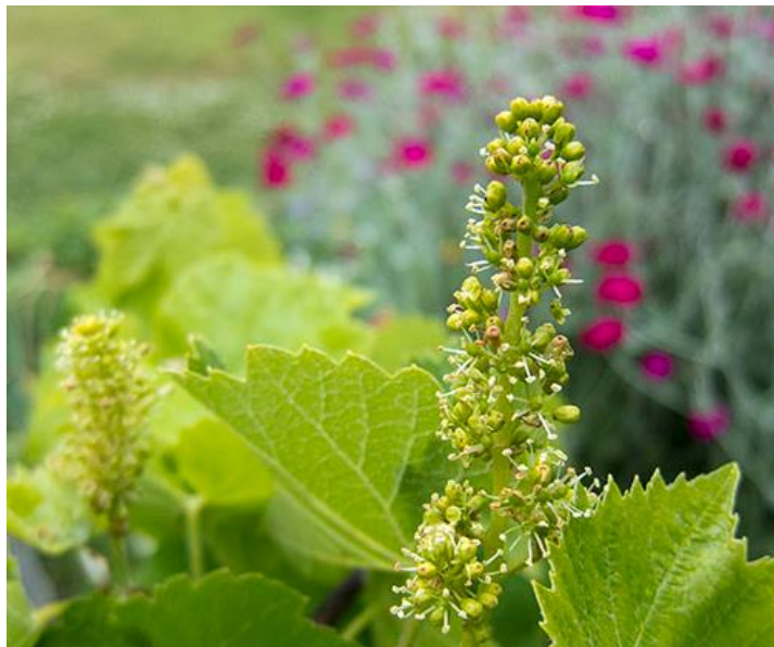
Slika 1. Cvat vinove loze