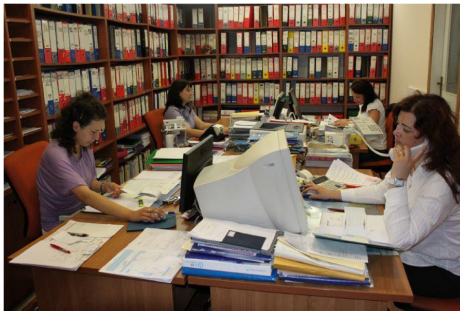
Slika 4: Knjigovodstveni ured

Poduzetnik je dužan prikupljati i sastavljati knjigovodstvene isprave, voditi poslovne knjige te sastavljati financijske izvještaje sukladno ovom Zakone i na temelju njega donesenim propisima, poštujući pri tome standarde financijskog izvještavanja te temeljna načela urednog knjigovodstva.