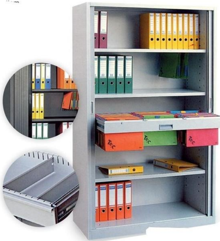
Slika 3: Arhivski ormar s registratorima i mapama

Takav sustav za čuvanje dokumentacije uključuje mape, registratore, organizacijske trake, ormare, regale, metalne nosače za mape i tome slično (Slika 3).