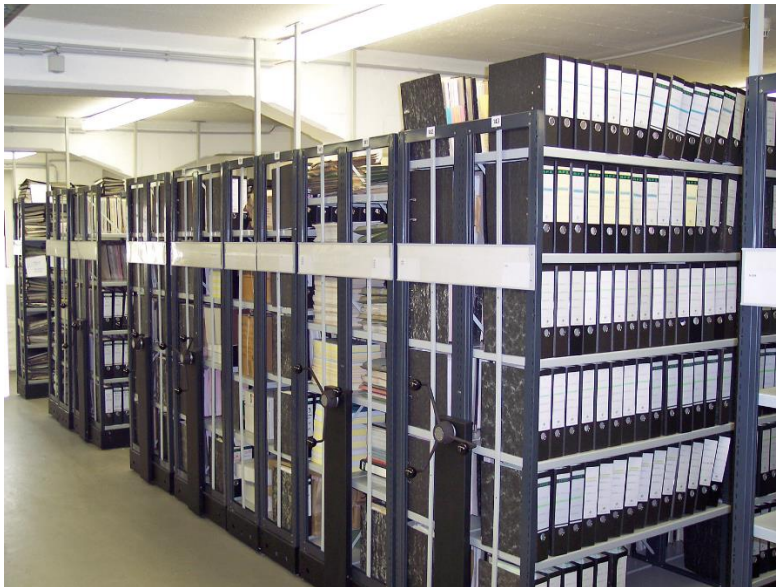
Slika 1: Arhiv, preuzeto s https://hamdocamo.files.wordpress.com/2013/06/drzavni-arhiv.png

Taj pojam koriste i mnogi ponuđači digitalnih registraturnih sustava, a ustvari se radi o elektronskom sustavu obrade podataka u cjeloviti sustav koji se, međutim, naziva elektronsko arhiviranje. Kod arhiviranja dokumenata širokog opsega sadržaja javlja se problem trajnosti očuvanja podataka, njihove usporedivosti i drugih tehničkih karakteristika.