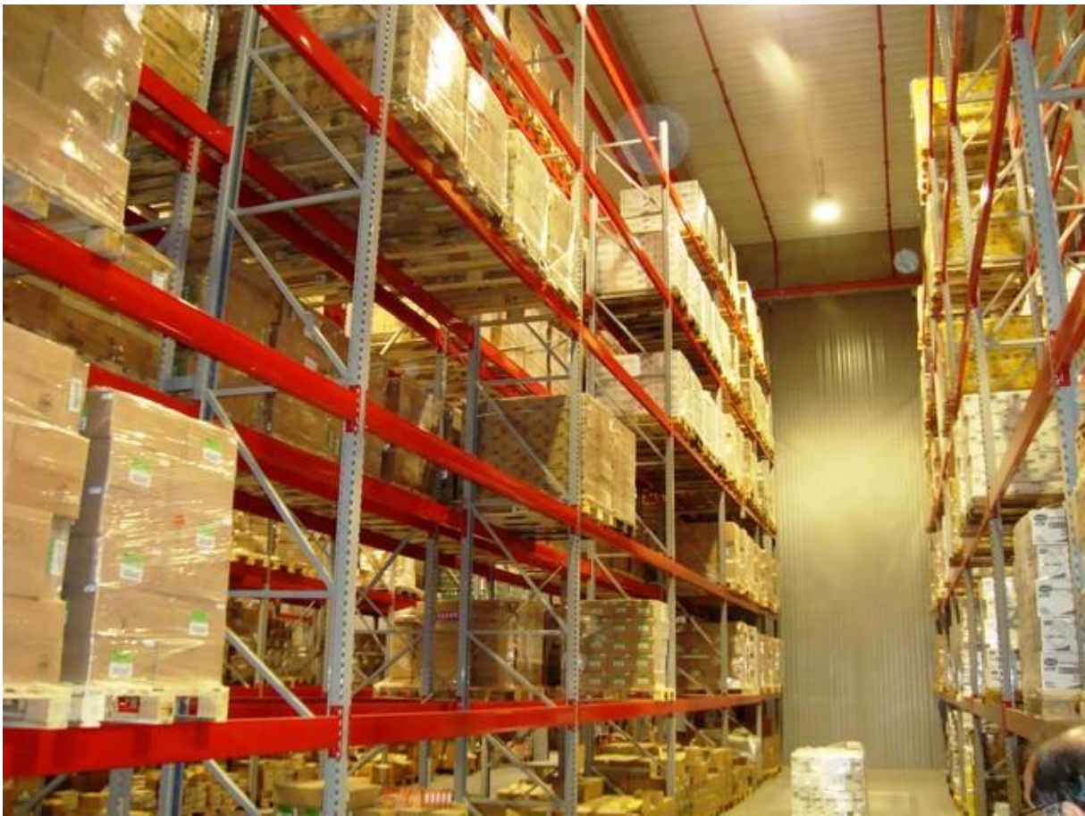
Slika 4. Skladišni prostor ALCE Pleternica

kao i primjerice u cestovnom, željezničkom i zračnom prijevozu robe. Paleta je 0,96 m 2 , dimenzija je 120 x 80 x 14,4 cm a težina iznosi 20 – 24 kg. Nosivost palete iznosi 1500 kg. Za skladištenje robe u ALCI zaslužni su viličari kojih ALCA ima 3. Viličari pružaju maksimalnu sigurnost na radu, udobnost, funkcionalnost, te ekonomičnost. Zadaci i poslovi smještaja i čuvanja robe u ALCI su sortiranje, pronalaženje mjesta za smještaj robe, dopunsko pakovanje (ako je potrebno), osiguranje, čuvanje i kontrola visine zaliha uskladištene robe.