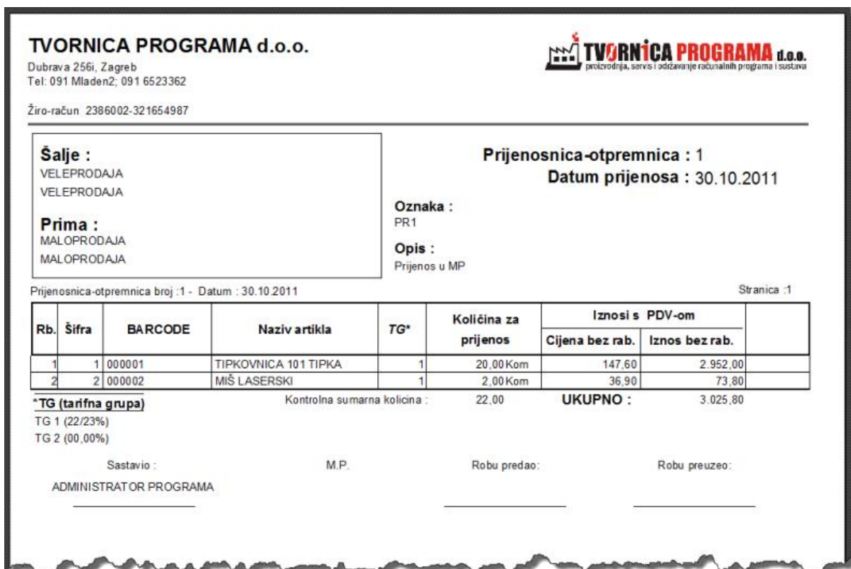
SLIKA 6. Primjer otpremnice

Odjel izlaza robe se bavi upućivanjem robe primateljima i pripravnim poslovima. Skladištar primanjem naloga za izdavanje robe prvo mora provjeriti da li je nalog za izdavanje napisano na pravilan način, te potpisan od ovlaštene osobe.