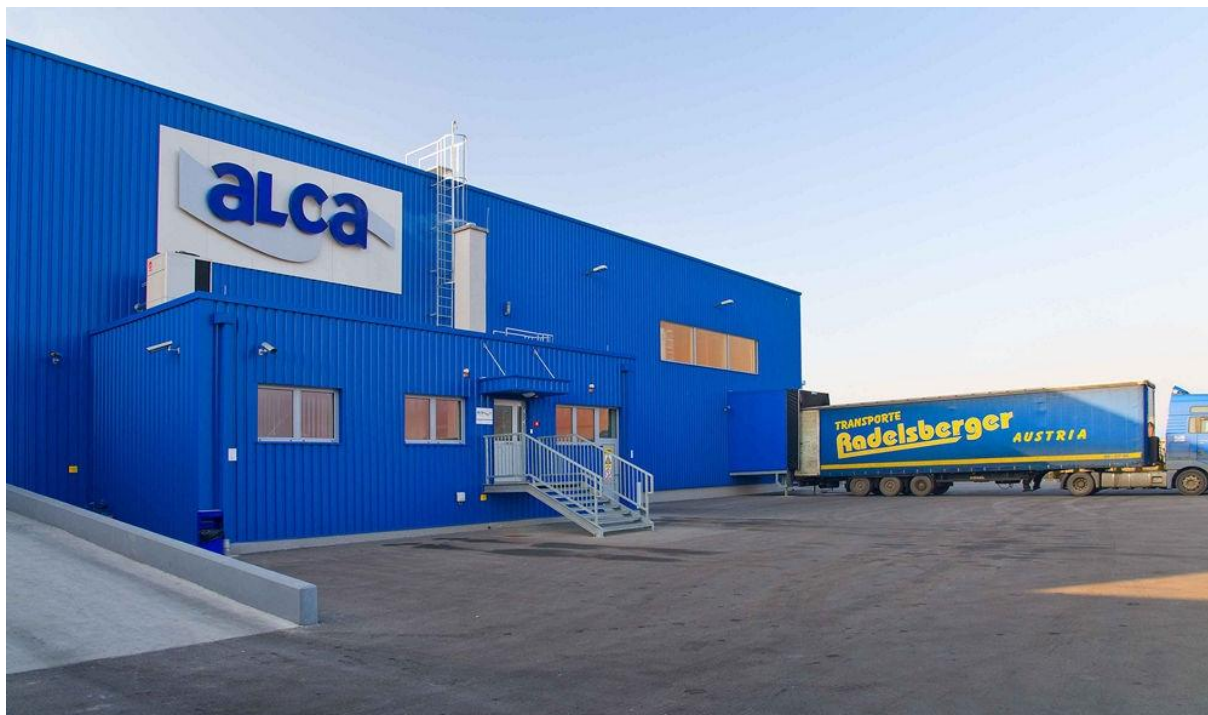
Slika 3. Alca skladište Pleternica.