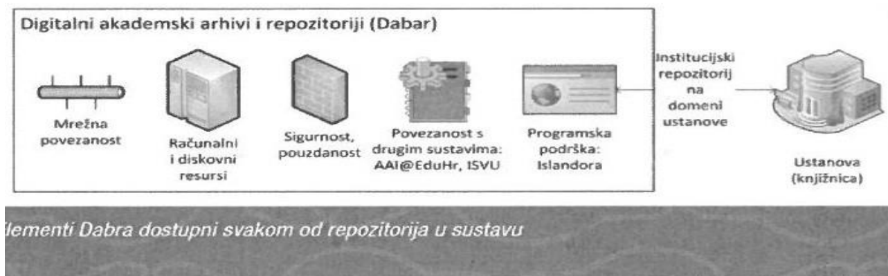
Slika 1. Prikaz mogućnosti digitalnog akademskog arhiva i repozitorija[6]

Osim toga daje mogućnost objave sadržaja u otvorenom pristupu te time povećava vidljivost objavljenih sadržaja same ustanove. Ono što je i najbitnije dugoročno i pouzdano čuva podatke svake ustanove. U početku je to bilo napravljeno kao rješenje za pohranu završnih radova studenata koje propisuje Nacionalna i sveučilišna Knjižnica na temelju odredbi Zakona o znanstvenoj djelatnosti i visokom obrazovanju.