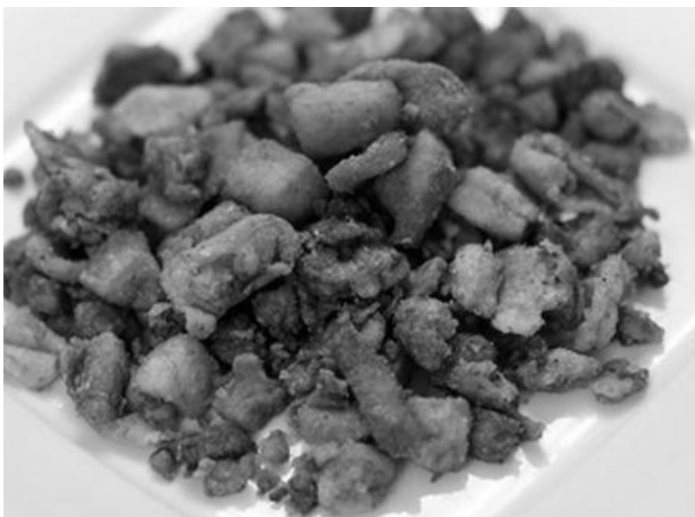
Slika 1. Čvarci [6]

nema opasnosti od pregrijavanja. Temperatura topljenja ne bi smjela biti viša od 115 °C. Vrlo je bitno da se zagrijavanje prekine prije nego ispari sva voda, da mast ne bi poprimila tamnu boju. Postoji i mogućnost zagaranja i zato je važno stalno miješanje. Topljenje je završeno kada prestane izlazak pare iz kotla, a čvarci poprime karakteristična svojstva. Odmah po završetku topljenja mast se cijedi od čvaraka u bazene za taloženje, a čvarci se prešaju i hlade postupkom rastresanja na što većoj površini. Mast u bazenima za taloženje zadržava se 3 do 4 sata, zatim odvodi u bazene za hlađenje. U bazenima za hlađenje nalaze se mehaničke miješalice radi ravnomjernijeg hlađenja, a hlađenje se provodi hladnom vodom koja struji kroz dvostruku stjenku bazena za hlađenje. Nakon hlađenja slijedi pakovanje. [1]