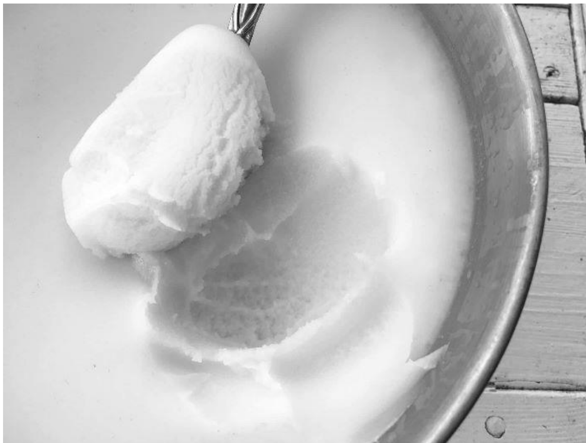
Slika 2. Domaća svinjska mast [7]

kao jedna od komponenti u hrani namijenjenoj za pse i mačke. Iz njih se dalje može izdvajati mast, a čvarci prerađivati u proteinski proizvod tipa mesno-koštanog brašna. Koji će se postupak topljenja koristiti ovisi o kapacitetu. Za manje kapacitete uglavnom se koristi suhi postupak, a za veće (industrijsku preradu) mokri postupak topljenja. [1]